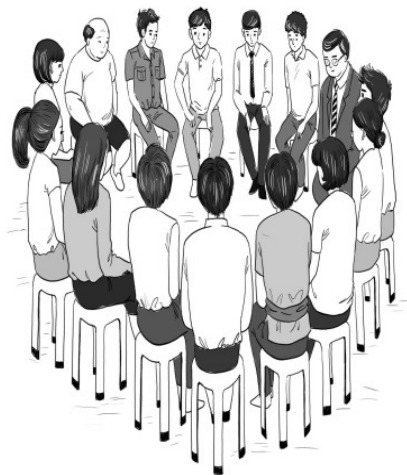
ประชาธิปไตยแบบสามเส้าหาทางออก