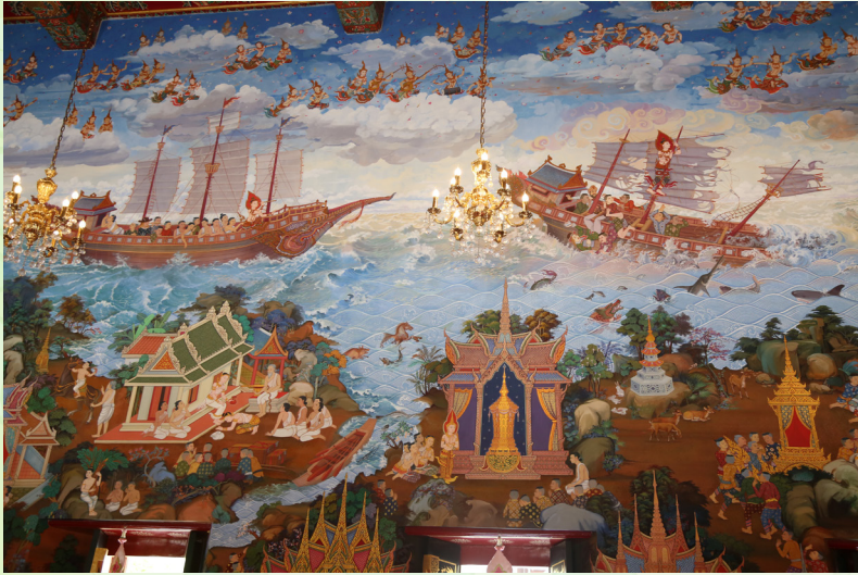
ภาพจิตรกรรมเล่าเรื่อง “มหาชนกชาติก”