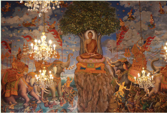
ภาพพุทธประวัติตอนมารผจญ

๕ เพื่อร่วมเฉลิมพระเกียรติพระบาทสมเด็จพระเจ้าอยู่หัวรัชกาลที่ ๙ ที่ทรงพระราชศรัทธาและทรงได้รับแรงบันดาลใจพระราชหฤทัยในการทรงพระราชนิพนธ์ “พระมหาชนก” จากที่ทรงสดับพระธรรมเทศนา “มหาชนก” ของสมเด็จพระมหาวิรวงศ์ อดิตเจ้าอาวาสวัดราชผาติการาม ใน เรื่องเดียวกัน