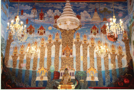
ภาพจักรวาลไตรภูมิ

เล่าเรื่อง “มหาชนกชาดก” ๕ ตามที่ปรากฏในพระไตรปิฎก ผสานกับ “พระมหาชนก” พระราชนิพนธ์ในพระบาทสมเด็จพระปรมินทรมหาภูมิพลอดุลยเดช บรมนาถบพิตร โดยแบ่งเนื้อหาออกเป็น ๙ กลุ่มเป็นการเขียนด้วยเทคนิควิธีการอุดมคติแบบผสมผสานกับแนวคิดปัจจุบัน