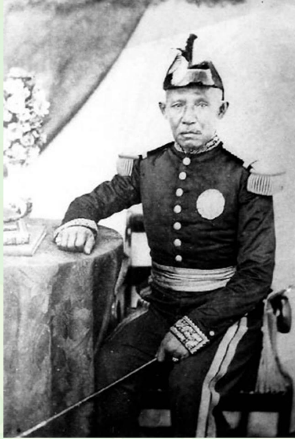
พระบาทสมเด็จพระปิ่นเกล้าเจ้าอยู่หัว

เมื่อถึงสมัยพระบาทสมเด็จพระจุลจอมเกล้าเจ้าอยู่หัว จึงโปรดเกล้าฯ ให้สมเด็จพระบรมราชเจ้า กรมพระราชวังบวรวิไชยชาญ พระโอรสองค์ใหญ่ในพระบาทสมเด็จพระปิ่นเกล้าเจ้าอยู่หัว ทรงดำเนินการสืบต่อ แต่การก่อสร้างได้หยุดชะงักลง เนื่องจากกรมพระราชวังบวรวิไชยชาญเสด็จทิวงคต