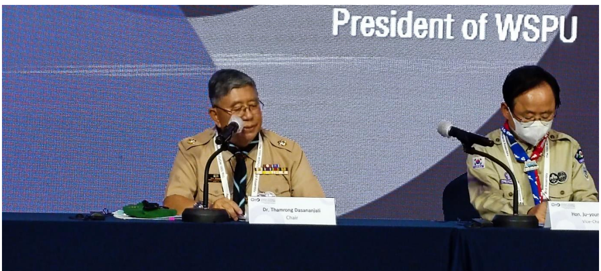
นายธำรง ทศนาญชลี ประธานสหภาพลูกเสือรัฐสภาโลก ทำหน้าที่ประธานการประชุมเต็มคณะ ในการประชุมสมัชชาใหญ่สหภาพลูกเสือรัฐสภาโลก ครั้งที่ ๑๐

จากนั้น นายธำรง ทศนาญชลี ประธานการประชุมกล่าวสุนทรพจน์ต้อนรับผู้เข้าร่วมประชุมมีเนื้อหาโดยสรุปกล่าวถึงผลงานในตลอด ๔ ปีที่ผ่านมาในฐานะประธานสหภาพลูกเสือรัฐสภาโลก ซึ่งตนเองได้ทำงานอย่างมุ่งมั่นในการขับเคลื่อนปฏิญญากรุงเทพฯ แผนปฏิบัติการสหภาพลูกเสือรัฐสภาโลก ปี ๒๕๖๒-๒๕๖๕ วาระการพัฒนา ๒๐๓๐ เพื่อการพัฒนาที่ยั่งยืนให้เกิดผลอย่างเป็นรูปธรรม รวมถึงการให้ความสำคัญกับเรื่องการจัดการความเสี่ยงในการจัดกิจกรรมลูกเสือให้แก่เด็กและเยาวชนเพื่อให้สามารถเรียนรู้ได้อย่างปลอดภัยและสนุกสนาน นอกจากนี้ ยังได้กล่าวถึงความประทับใจและประสบการณ์ที่มีคุณค่าอย่างมากตลอดระยะเวลาที่ดำรงตำแหน่งประธานสหภาพลูกเสือรัฐสภาโลก รวมถึงได้กล่าวขอบคุณรัฐสภาไทย เลขาธิการสภาผู้แทนราษฎร รองเลขาธิการสภาผู้แทนราษฎร ด้านต่างประเทศ รวมถึงเจ้าหน้าที่ที่ช่วยสนับสนุนการทำงานของตนให้ประสบผลสำเร็จเป็นอย่างดี