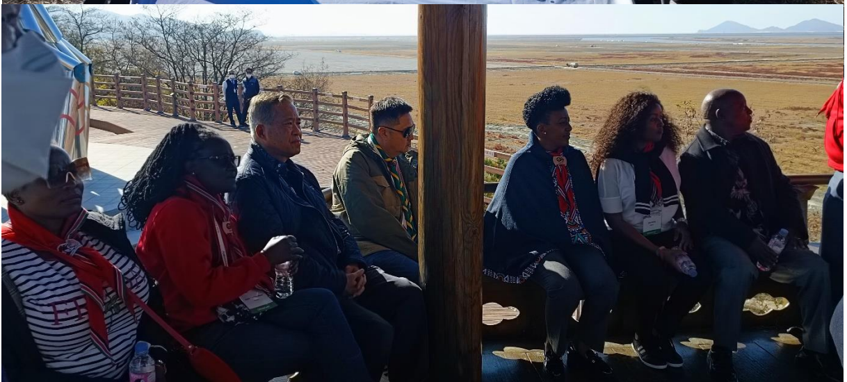
ผู้เข้าร่วมการประชุมเดินทางไปเยี่ยมชมสถานที่จัดงานชุมนุมลูกเสือโลก ครั้งที่ ๒๕ ที่จะจัดขึ้นระหว่างวันที่ ๑ – ๑๒ สิงหาคม ๒๕๖๖ ณ Saemangeum สาธารณรัฐเกาหลี