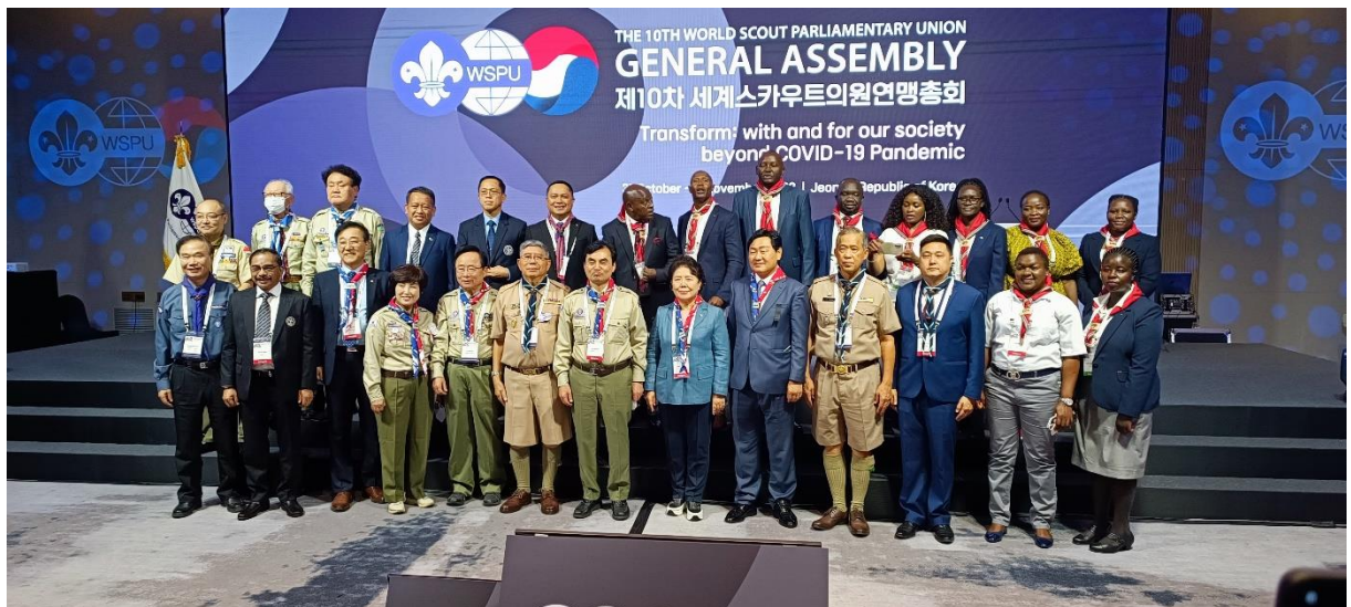
ผู้เข้าร่วมประชุมถ่ายรูปร่วมกัน