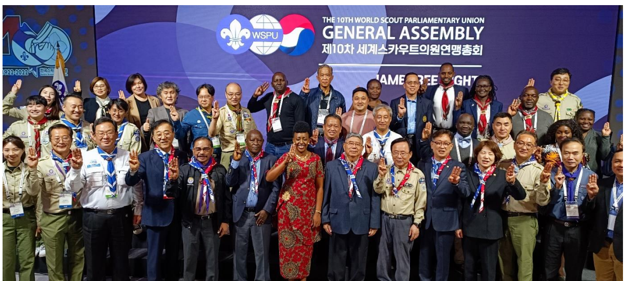
ผู้เข้าร่วมการประชุมถ่ายรูปร่วมกันในพิธีปิดการประชุม