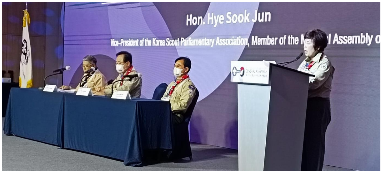
Hon. Hye-Sook Jun สมาชิกสภาและรองประธานชมรมลูกเสือรัฐสภาเกาหลี กล่าวทักทายและต้อนรับผู้เข้าร่วมการประชุม