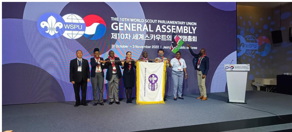
พิธีส่งมอบธงสหภาพลูกเสือรัฐสภาโลกให้แก่คณะผู้แทนจากสาธารณรัฐเคนยา