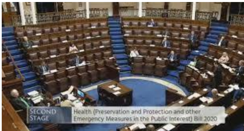
ห้องประชุมรัฐสภาสาธารณรัฐไอร์แลนด์

ในช่วงของการแพร่ระบาดของเชื้อไวรัสโคโรนา (COVID-19) รัฐธรรมนูญไอร์แลนด์ไม่อนุญาตให้ลงคะแนนเสียงทางไกลหรือประชุมผ่านระบบออนไลน์