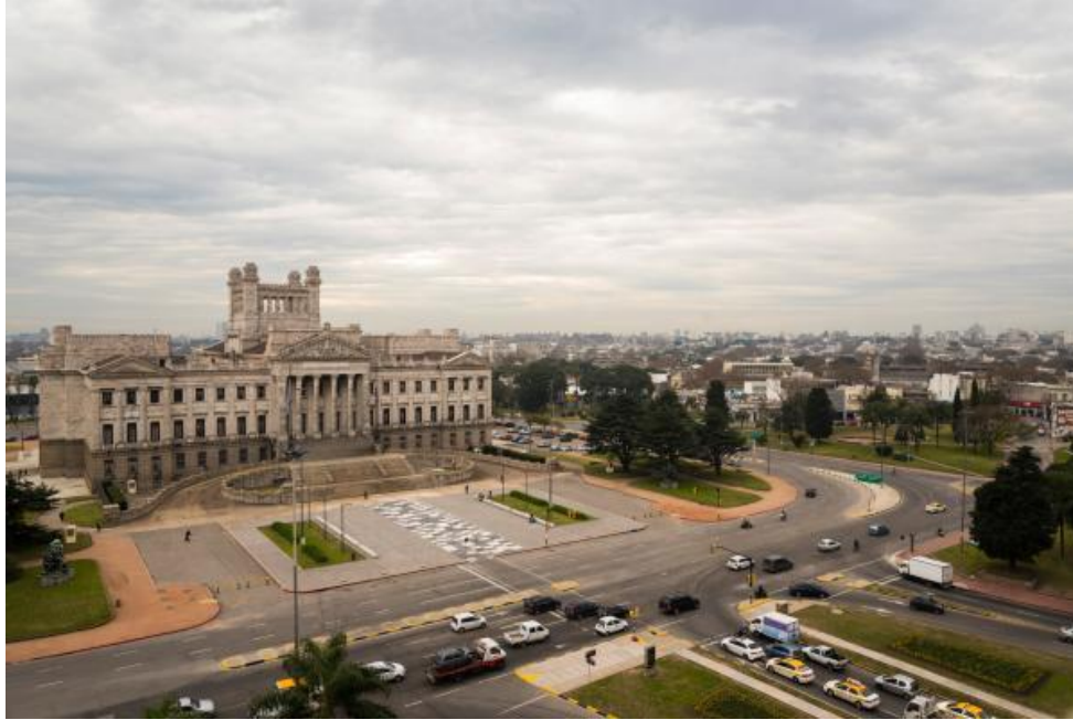
ภาพรัฐสภาสาธารณรัฐบุรพาอูรุกวัย