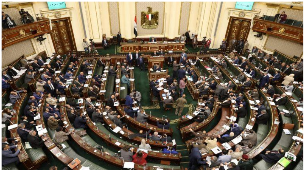
ห้องประชุมรัฐสภาอียิปต์

รัฐสภาอียิปต์ชุดใหม่ซึ่งได้รับการเลือกตั้งในปี ๒๕๖๓ (เข้ารับตำแหน่งปี ๒๕๖๔) ได้จัดพิธีเปิดสมัยการประชุมในวันอังคารที่ ๑๒ มกราคม ๒๕๖๔ ซึ่งมีการถ่ายทอดสดทางโทรทัศน์ โดยเลขาธิการรัฐสภาอียิปต์ได้รายงานว่ สมาชิกรัฐสภาที่ได้รับการเลือกตั้งทุกคนจะไม่รวมตัวกันในห้องประชุมรัฐสภาเพื่อทำพิธีสาบานตนตามรัฐธรรมนูญ ทั้งนี้ เนื่องมาจากมาตรการป้องกันเชื้อไวรัสโคโรนา (COVID-19) แต่กระบวนการนี้จะแบ่งออกเป็น