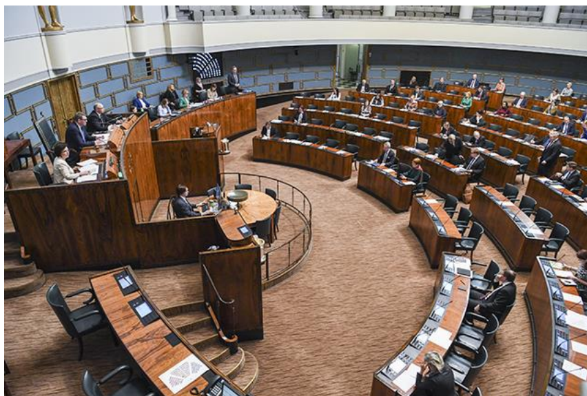
การรักษาระยะห่างในห้องประชุมรัฐสภาสาธารณรัฐฟินแลนด์

สมาชิกรัฐสภาฟินแลนด์สามารถทำงานผ่านระบบการประชุมทางไกลและเข้าร่วมการประชุมรัฐสภาได้โดยใช้เครื่องมือดิจิทัล ตามมติของที่ประชุมร่วมกันของประธานรัฐสภาและประธานคณะกรรมการสิทธิมนุษยชน เมื่อวันที่ ๒๔ มีนาคม ๒๕๖๓ เนื่องจากมีการประกาศสถานการณ์ฉุกเฉินทั่วประเทศเพื่อป้องกันการแพร่ระบาดของเชื้อไวรัสโคโรนา (COVID-19) อย่างไม่ดี สมาชิกรัฐสภาจะไม่สามารถลงมติผ่านระบบการประชุมทางไกลได้