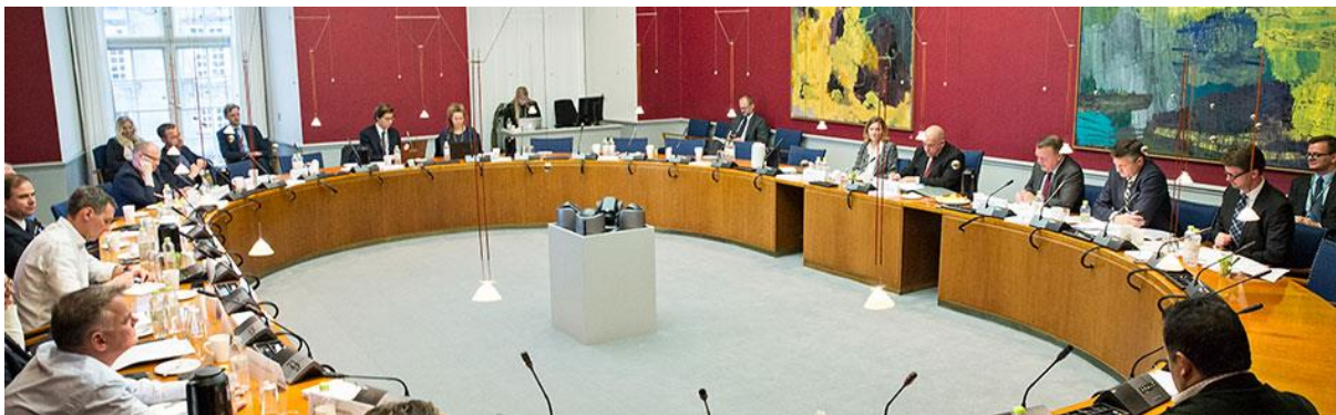
การประชุมคณะกรรมการของรัฐสภาเดนมาร์ก

รัฐสภาเดนมาร์กงดเข้าเยี่ยมชมรัฐสภาทั้งสำหรับหมู่คณะและบุคคลทั่วไป ขณะที่กิจการของรัฐสภาที่สำคัญยังคงดำเนินไปอย่างต่อเนื่อง มีการใช้มาตรการต่าง ๆ เพื่อให้งานของรัฐสภาดำเนินต่อไป โดยกำหนดให้สมาชิกรัฐสภารักษาระยะห่างทางกายภาพที่จำเป็นในการลงมติผ่านร่างกฎหมาย ตลอดจนการเข้าร่วมในการประชุมของคณะกรรมการและงานสำคัญอื่น ๆ