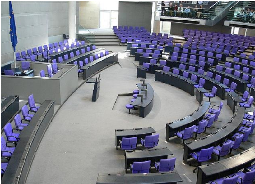
ห้องประชุมสภาเซเชลส์