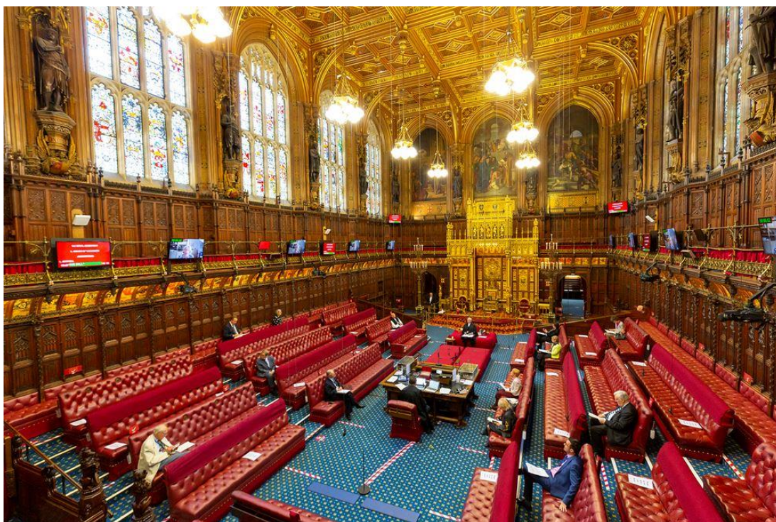
ภาพห้องประชุมรัฐสภาสหราชอาณาจักร