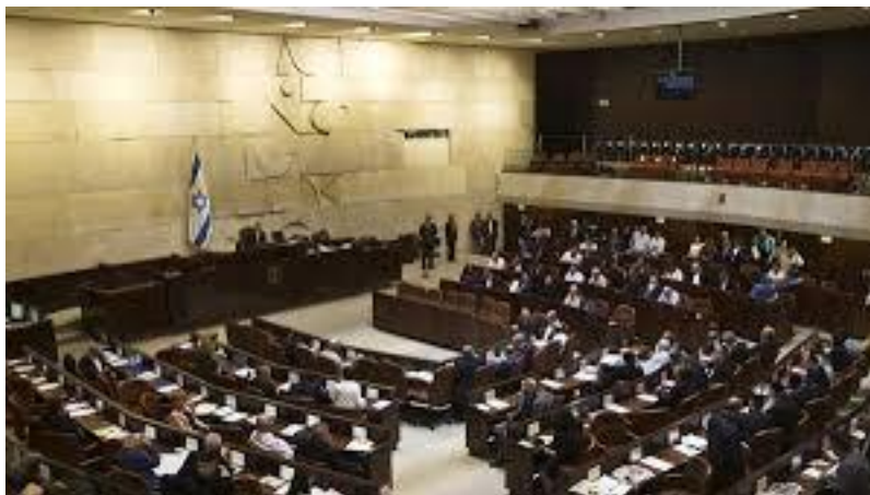
ห้องประชุมรัฐสภาอิสราเอล

ในเดือนพฤษภาคม ได้มีการจัดตั้งคณะกรรมการพิเศษเกี่ยวกับไวรัสโคโรนาและการประเมินความพร้อมของรัฐเรื่องโรคระบาดและแผ่นดินไหว กระทรวงสาธารณสุขได้อนุญาตให้โรงงานอุตสาหกรรมและห้างร้านต่าง ๆ เปิดทำการภายใต้กฎการรักษาระยะห่างและการควบคุมสุขอนามัยอย่างเข้มงวดที่เรียกว่ากฎตราสีม่วง รัฐบาลจึงได้บังคับใช้กฎตราสีม่วงกับสถานที่สาธารณะทุกแห่งตามประกาศของกระทรวงสาธารณสุข