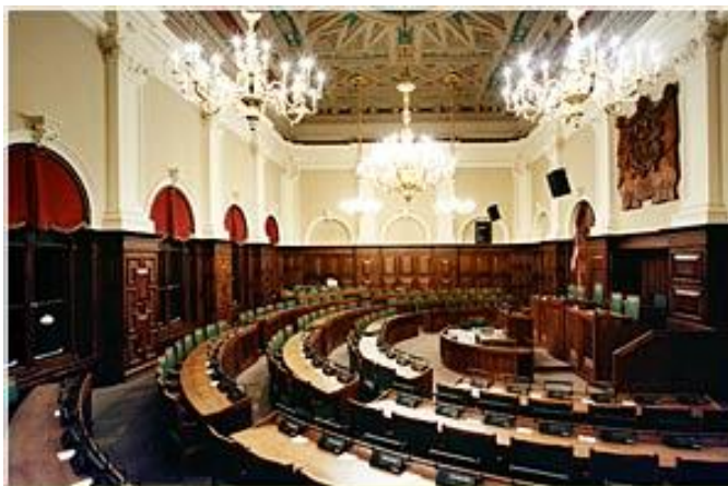
ห้องประชุมรัฐสภาสาธารณรัฐลัตเวีย

ในการประชุมรัฐสภาเมื่อวันที่ ๒๖ พฤษภาคม ๒๕๖๓ ได้เริ่มใช้แพลตฟอร์มการประชุมรัฐสภาอิเล็กทรอนิกส์ซึ่งมีการพัฒนาขึ้นมาโดยเฉพาะ ทำให้สมาชิกรัฐสภาสามารถประชุมผ่านระบบออนไลน์ได้ โดยสมาชิกรัฐสภาสามารถอภิปรายและลงคะแนนเสียงตามวาระการประชุมได้อย่างทันที่ สมาชิกรัฐสภาสามารถใช้อุปกรณ์ของตนในการเข้าร่วมการประชุมจากสถานที่อื่นนอกอาคารรัฐสภาได้