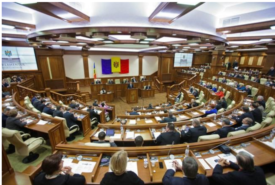
ห้องประชุมสภามอลโดวา

รัฐสภามอลโดวาอนุมัติแผนป้องกันการระบาดของเชื้อไวรัสโคโรนา (COVID-19) โดยได้มีการแนะนำมาตรการต่าง ๆ เช่น การปรับโครงสร้างการเข้าถึงสำนักงาน ศูนย์อาหาร ห้องส่วนกลาง การจำกัดจำนวนคนและผู้เยี่ยมชมเข้ามาในอาคาร การเว้นระยะห่างระหว่าง กองอำนาจการด้านเทคโนโลยีสารสนเทศและการสื่อสารของรัฐสภามอลโดวารับรองว่าเจ้าหน้าที่จะสามารถเข้าถึงระบบข้อมูลแบบบูรณาการของรัฐสภา ซึ่งจะรองรับการทำงานจากระยะไกลได้