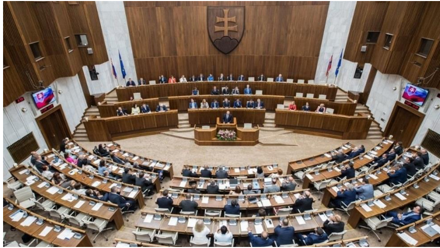
ห้องประชุมสภาสโลวัก