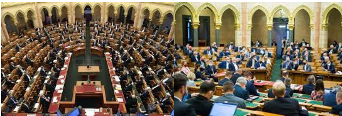
ห้องประชุมรัฐสภาฮังการี

ในวันที่ ๑๑ มีนาคม ๒๕๖๓ รัฐบาลฮังการีประกาศภาวะฉุกเฉิน ซึ่งมีมาตรการพิเศษในการควบคุมประชาชนตามที่กฎหมายได้บัญญัติเอาไว้ ภายใต้รัฐธรรมนูญฮังการี ภาวะฉุกเฉินนี้จะมีระยะเวลา ๑๕ วันจนกว่ารัฐสภาจะอนุญาตให้รัฐบาลขยายเวลาออกไป ซึ่งรัฐสภาได้ผ่านกฎหมายให้ขยายภาวะฉุกเฉินออกไปได้จนกว่าสถานการณ์จะกลับมาเป็นปกติ