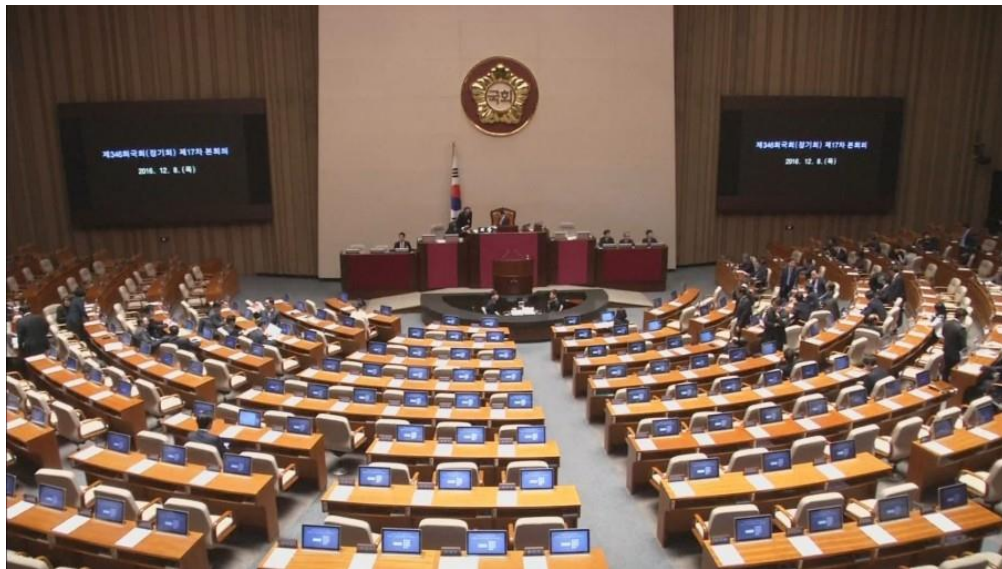
ห้องประชุมสภาสาธารณรัฐเกาหลี