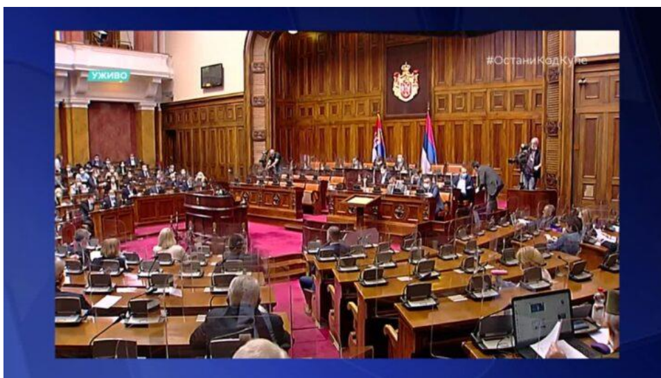
ห้องประชุมสภาเซอร์เบีย