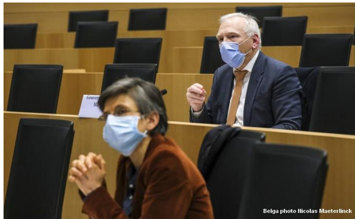
รัฐสภาราชอาณาจักรเบลเยียมประชุมแก้ไขกฎระเบียบการดำเนินการ ภายใต้สถานการณ์การแพร่ระบาดของเชื้อไวรัสโคโรนา (COVID-19)