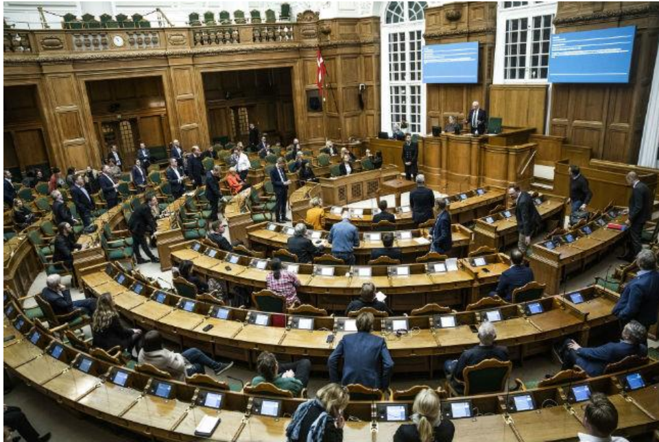
ห้องประชุมรัฐสภาเดนมาร์ก