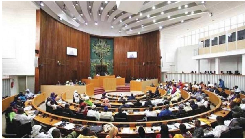
ห้องประชุมสภาเซเนกัล