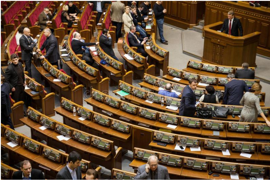
ภาพห้องประชุมรัฐสภายูเครน

การประชุมรัฐสภาได้จัดขึ้นตามปกติ และรัฐสภาได้ออกกฎหมายจำนวน ๑๒ ฉบับเพื่อรับมือกับการแพร่ระบาดของเชื้อไวรัสโคโรนา (COVID-19) สำหรับการประชุมรัฐสภาพิเศษที่จะจัดขึ้นในวันที่ ๒๔ เมษายน ภายในอาคารรัฐสภายูเครนนั้น จะต้องดำเนินการตามมาตรการรักษาระยะห่างระหว่างบุคคล สมาชิกรัฐสภาใช้การลงคะแนนเสียงผ่านทางระบบอิเล็กทรอนิกส์ และจะมีการถ่ายทอดการประชุมผ่านทางโทรทัศน์และช่องทางออนไลน์