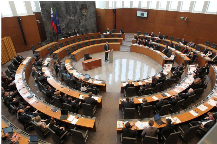
ห้องประชุมสภาสโลวีเนีย