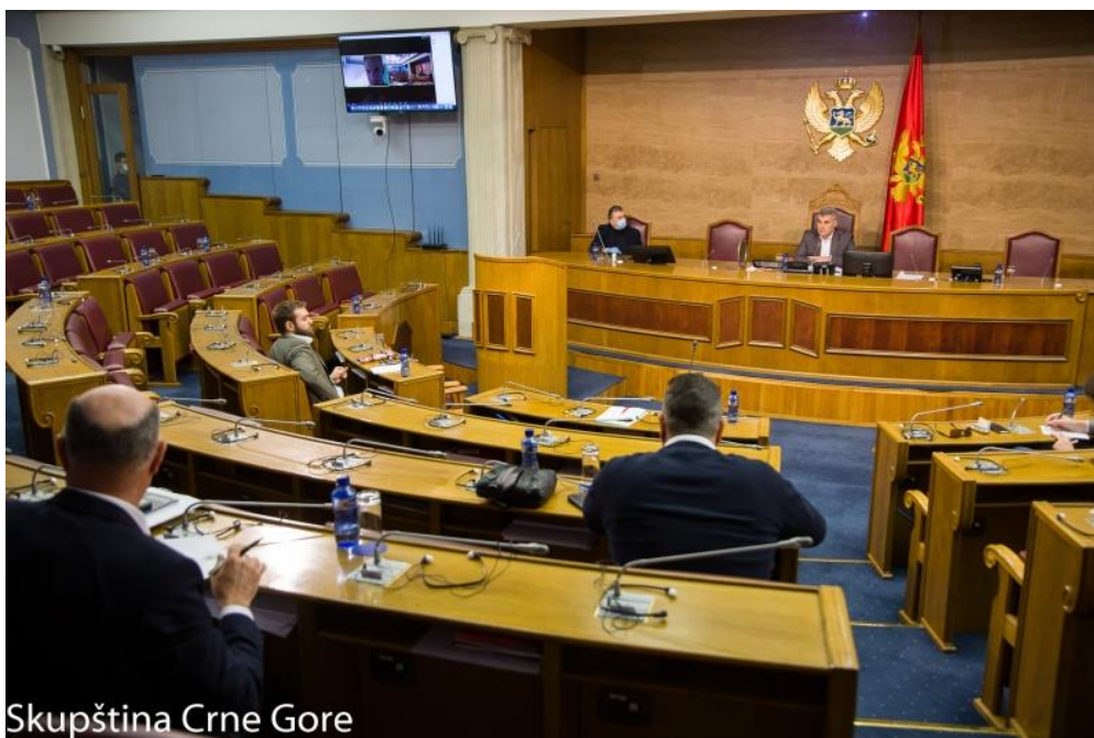
Skupština Crne Gore

การประชุมสภามอนเตเนโกรเป็นครั้งแรกผ่านระบบวิดีโอคอนเฟอเรนซ์ (video conference)