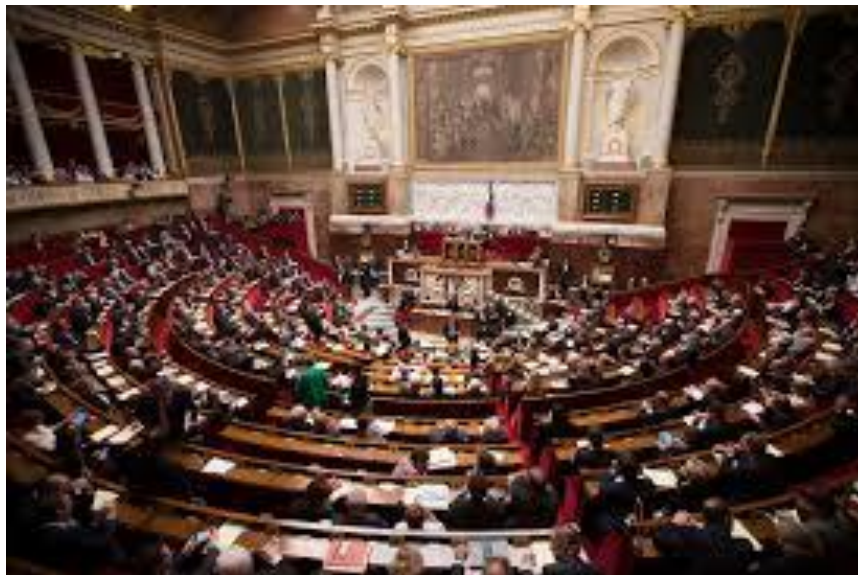
ห้องประชุมสภาผู้แทนราษฎรสาธารณรัฐฝรั่งเศส

ในช่วงการแพร่ระบาดของเชื้อไวรัสโคโรนา (COVID-19) รัฐสภาฝรั่งเศสลดจำนวนการประชุมลงและจัดประชุมระบบทางไกล ส่วนการประชุมคณะกรรมการถูกจำกัดเหลือแค่การพิจารณาและการอภิปรายในประเด็นที่เกี่ยวข้องกับไวรัสโคโรนาเท่านั้น การตัดสินใจในเรื่องดังกล่าวเป็นผลจากการประชุมร่วมกันระหว่างประธานรัฐสภาและรองประธานรัฐสภา หัวหน้าพรรคการเมือง ประธานคณะกรรมการและรัฐมนตรีที่มีความเกี่ยวข้องกับรัฐสภา