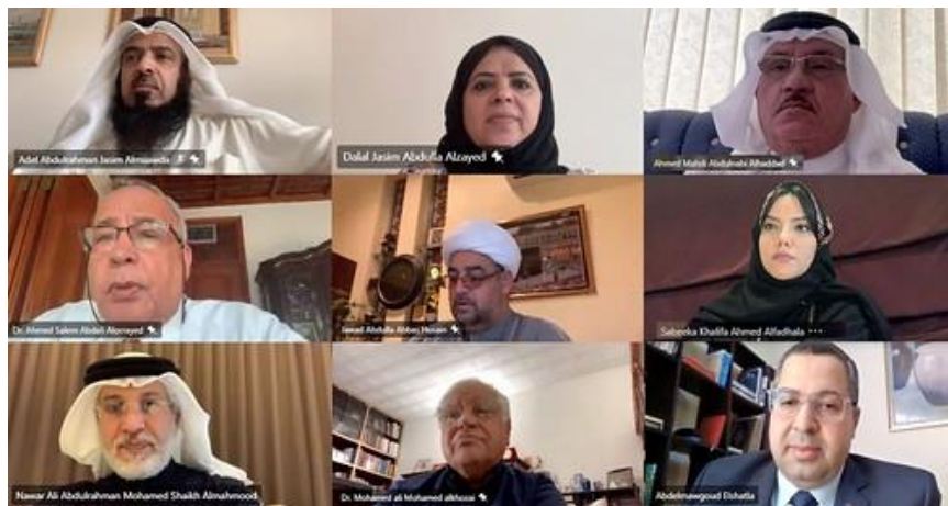
รัฐสภาราชอาณาจักรบาห์เรนจัดการประชุมทางไกลผ่านสื่ออิเล็กทรอนิกส์ ภายหลังการแพร่ระบาดของเชื้อไวรัสโคโรนา (COVID-19)