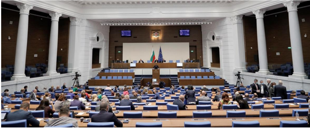
The Parliament adopted changes to the mandatory isolation and quarantine for contagious diseases, including COVID-19

ในช่วงแรกของการแพร่ระบาดของเชื้อไวรัสโคโรนา (COVID-19) และมีประกาศสถานการณ์ของภาวะฉุกเฉิน รัฐสภาสาธารณรัฐบัลแกเรียได้ระงับการประชุมรัฐสภาทั้งหมด โดยมีการพิจารณาประเด็นที่เกี่ยวข้องโดยตรงกับการบริหารประเทศภายใต้สถานการณ์ของภาวะฉุกเฉิน นอกจากนี้ รัฐสภาสาธารณรัฐบัลแกเรียได้จัดให้มีการประชุมทางไกล การเว้นระยะห่างระหว่างบุคคล และมีความเข้มงวดเกี่ยวกับการเข้า-ออกบริเวณรัฐสภา