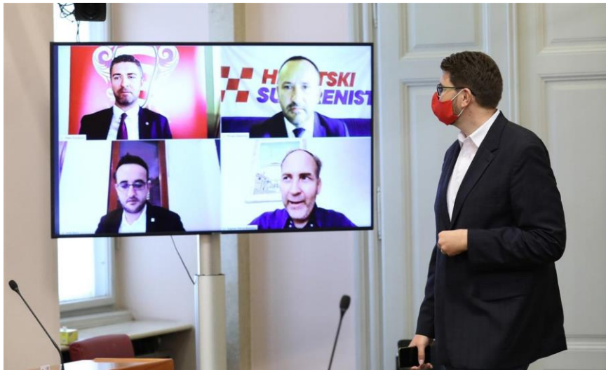
สมาชิกรัฐสภาโครเอเชียที่อยู่ระหว่างการกักกันตัวเองเข้าร่วมการอภิปรายผ่านระบบการประชุมทางไกล