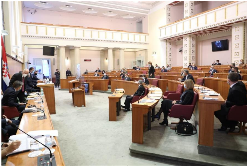
ห้องประชุมรัฐสภาโครเอเชีย ภายใต้มาตรการพิเศษ