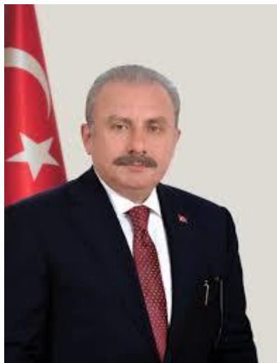
นายมุสตาฟา เซ็นทอป (Mr. Mustafa ŞENTOP) ประธานรัฐสภาตุรกี และประธานสมัชชารัฐสภาเอเชีย (Asian Parliamentary Assembly - APA)