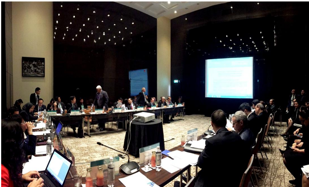
บรรยากาศห้องประชุมคณะกรรมการยกร่างฯ

๔. การประชุมคณะกรรมการยกร่างข้อมติและแถลงการณ์ร่วม (Meeting of the Drafting Committee) มีขึ้นในวันศุกร์ที่ ๑๙ และวันเสาร์ที่ ๒๐ มกราคม ๒๕๖๑ เพื่อทำหน้าที่พิจารณาร่างปฏิญญาฮานอย การแก้ไขข้อบังคับการประชุม และร่างข้อมติที่เสนอโดยที่ประชุมคณะทำงาน รวมทั้งพิจารณาและยกร่างแถลงการณ์ร่วม ซึ่งเป็นเอกสารสุดท้ายของการประชุมที่ได้สรุปสาระสำคัญจากการประชุม โดยมีข้อมติในประเด็นต่าง ๆ ที่ผ่านการเห็นชอบจากที่ประชุมฯ จำนวน ๑๔ ข้อมติ (จากจำนวน ๔๔ ร่างข้อมติที่ประเทศต่าง ๆ เสนอ) เพื่อเสนอให้ที่ประชุมเต็มคณะรับรอง