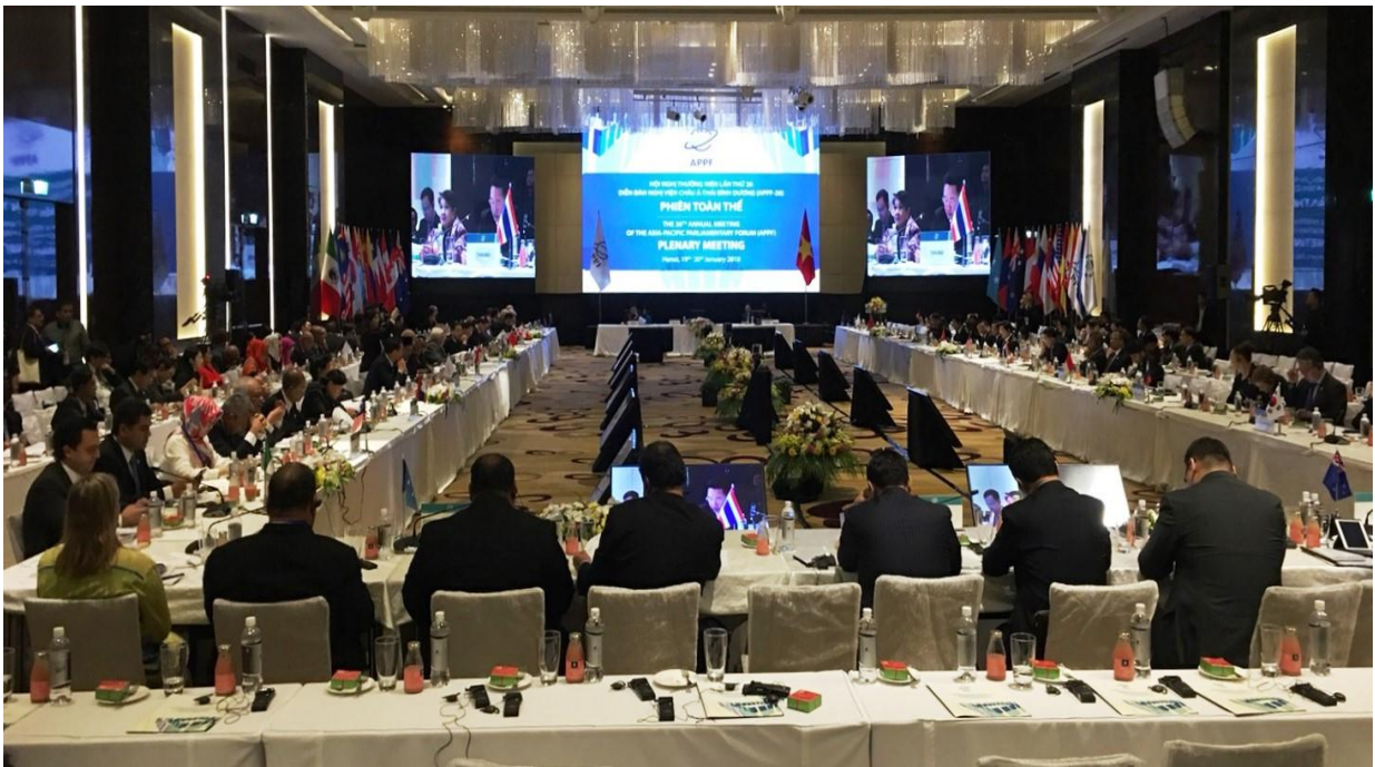
บรรยากาศภายในห้องประชุมเต็มคณะฯ

๕.๔ วาระด้านการดำเนินกิจกรรมของ APPE ที่ประชุมฯ ได้รับทราบและพิจารณาเกี่ยวกับบทบาทของ APPF ในการส่งเสริมความเป็นหุ้นส่วนเพื่อการพัฒนาที่ยั่งยืนและการเติบโตอย่างมีส่วนร่วมในเอเชีย-แปซิฟิก การแก้ไขข้อบังคับการประชุม APPF เรื่องการประชุมสมาชิกรัฐสภาสตรี การเป็นเจ้าภาพจัดการประชุม APPF ครั้งต่อไปโดยรัฐสภาราชาอาณาจักรกัมพูชา ในปี ๒๕๖๒ ณ จังหวัดเสียมราฐ และการรับรองข้อมติและแถลงการณ์ร่วม ซึ่งที่ประชุมฯ ได้รับรองข้อมติ จำนวน ๑๔ ข้อมติ ซึ่งเกี่ยวข้องกับประเด็นต่าง ๆ ในด้านการเมืองและความมั่นคง ด้านเศรษฐกิจและการค้า และด้านความร่วมมือในระดับภูมิภาค และด้านการดำเนินกิจกรรมของ APPF