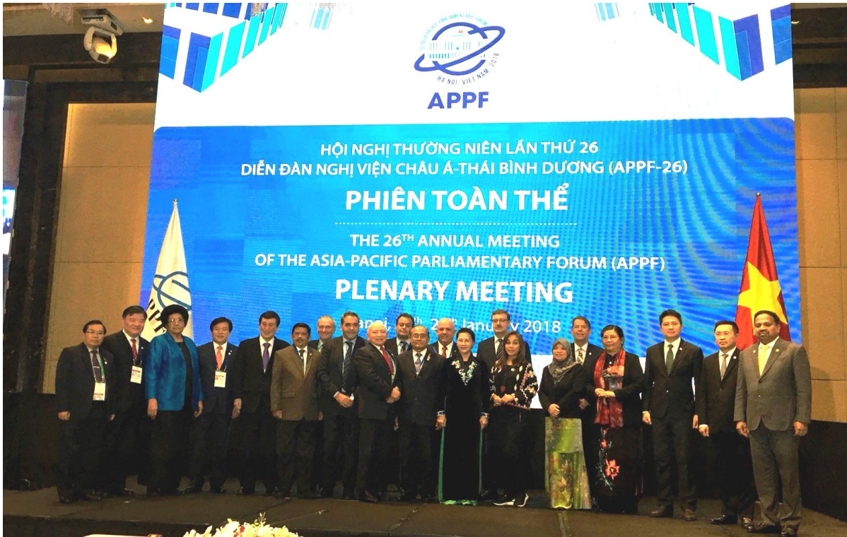
หัวหน้าคณะผู้แทนจากประเทศต่าง ๆ ถ่ายรูปร่วมกันในพิธีปิดการประชุม