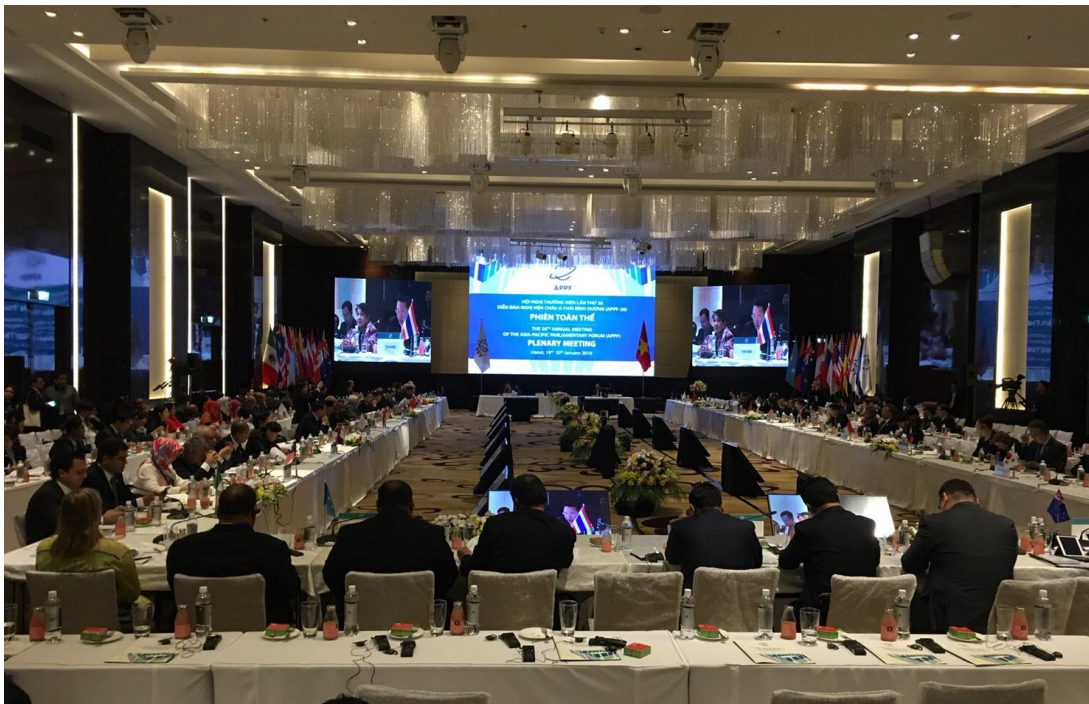
สมาชิกรัฐสภาจากประเทศสมาชิกและประเทศผู้สังเกตการณ์ในการประชุม APPF ครั้งที่ ๒๖

การประชุมประจำปีรัฐสภาภาคพื้นเอเชียและแปซิฟิก ครั้งที่ ๒๖ (The 26 th Annual Meeting of the Asia – Pacific Parliamentary Forum – APPF) จัดขึ้นระหว่างวันที่ ๑๘-๒๑ มกราคม ๒๕๖๑ ณ โรงแรม J.W. Marriott กรุงเทพมหานคร สาธารณรัฐสังคมนิยมเวียดนาม มีผู้เข้าร่วมการประชุมจำนวน ๓๕๔ คน โดยมีรัฐสภาจากประเทศสมาชิกเข้าร่วมการประชุมจำนวน ๒๐ ประเทศ และประเทศผู้สังเกตการณ์จำนวน ๑ ประเทศ ได้แก่ บรูไนดารุสซาลาม