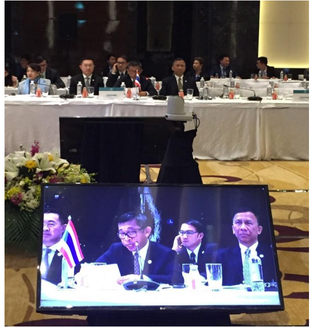
พลเรือเอก ทวีวุฒิ พงศ์พิพัฒน์ กล่าวถ้อยแถลงในการประชุมเต็มคณะ วาระที่ ๓ ด้านความร่วมมือด้านการพัฒนาในภูมิภาค

๒) หัวข้อ “การส่งเสริมความร่วมมือทางวัฒนธรรมและการท่องเที่ยวระดับภูมิภาค” (Fostering regional cultural and tourism cooperation) ซึ่งได้กล่าวถึงการท่องเที่ยวในฐานะอุตสาหกรรมที่โดดเด่นที่สุดอย่างหนึ่งของโลกและเกี่ยวข้องกับผู้คนหลากหลายวัฒนธรรม ส่งผลให้เกิดความเข้าใจทางวัฒนธรรมและสร้างความสัมพันธ์อันดีระหว่างทุกภาคส่วน และเชื่อว่าการท่องเที่ยวที่เข้มแข็งต้องเริ่มจากระดับท้องถิ่นในเรื่องการบริการ ความหลากหลาย และวัฒนธรรมที่มีมาอย่างยาวนานของประเทศ ทั้งนี้ เห็นว่าในฐานะสมาชิกรัฐสภา ควรปรับปรุงและออกกฎหมายที่สนับสนุนความร่วมมือด้านการท่องเที่ยวและวัฒนธรรม พร้อมทั้งเห็นว่าทุกภาคส่วนควรร่วมมือกันเพื่อส่งเสริมความร่วมมือด้านวัฒนธรรมและการท่องเที่ยวเพื่อให้บรรลุเป้าหมายการพัฒนาที่ยั่งยืน ความเป็นอยู่ที่ดีของประชาชน และส่งเสริมความสัมพันธ์ระหว่างประเทศ