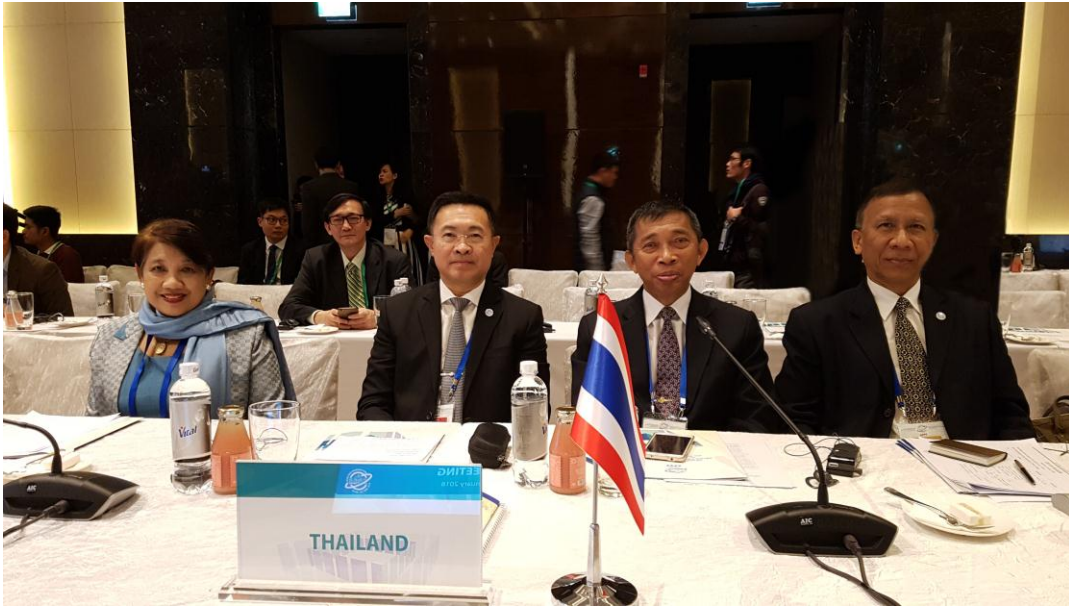
คณะผู้แทนสภานิติบัญญัติแห่งชาติในการประชุมประจำปีรัฐสภาภาคพื้นเอเชียและแปซิฟิก ครั้งที่ ๒๖