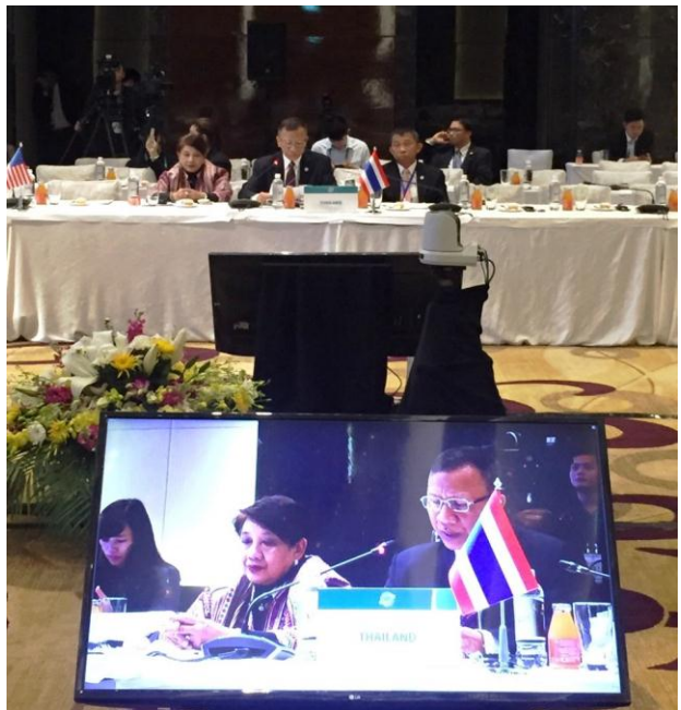
พลเรือเอก พลลภ ตมิกานนท์ กล่าวถ้อยแถลงในการประชุมเต็มคณะ วาระที่ ๒ ด้านเศรษฐกิจและการค้า