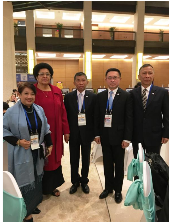
/๒. วันศุกร์...