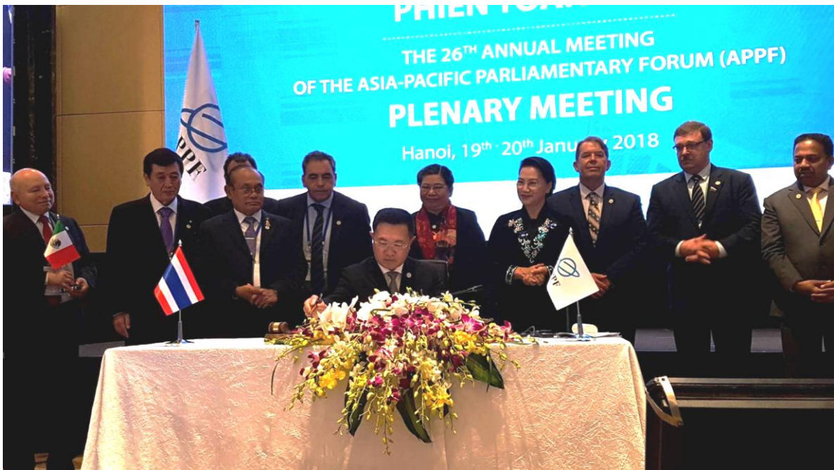
พลเอก สุรพงษ์ สุวรรณอัตถ์ หัวหน้าคณะผู้แทนสภานิติบัญญัติแห่งชาติฯ ลงนามในแถลงการณ์ร่วม

๒) หัวข้อ “การส่งเสริมความร่วมมือทางวัฒนธรรมและการท่องเที่ยวระดับภูมิภาค” (Fostering regional cultural and tourism cooperation) ซึ่งได้กล่าวถึงการท่องเที่ยวในฐานะอุตสาหกรรมที่โดดเด่นที่สุดอย่างหนึ่งของโลกและเกี่ยวข้องกับผู้คนหลากหลายวัฒนธรรม ส่งผลให้เกิดความเข้าใจทางวัฒนธรรมและสร้างความสัมพันธ์อันดีระหว่างทุกภาคส่วน และเชื่อว่าการท่องเที่ยวที่เข้มแข็งต้องเริ่มจากระดับท้องถิ่นในเรื่องการบริการ ความหลากหลาย และวัฒนธรรมที่มีมาอย่างยาวนานของประเทศ ทั้งนี้ เห็นว่าในฐานะสมาชิกรัฐสภา ควรปรับปรุงและออกกฎหมายที่สนับสนุนความร่วมมือด้านการท่องเที่ยวและวัฒนธรรม พร้อมทั้งเห็นว่าทุกภาคส่วนควรร่วมมือกันเพื่อส่งเสริมความร่วมมือด้านวัฒนธรรมและการท่องเที่ยวเพื่อให้บรรลุเป้าหมายการพัฒนาที่ยั่งยืน ความเป็นอยู่ที่ดีของประชาชน และส่งเสริมความสัมพันธ์ระหว่างประเทศ