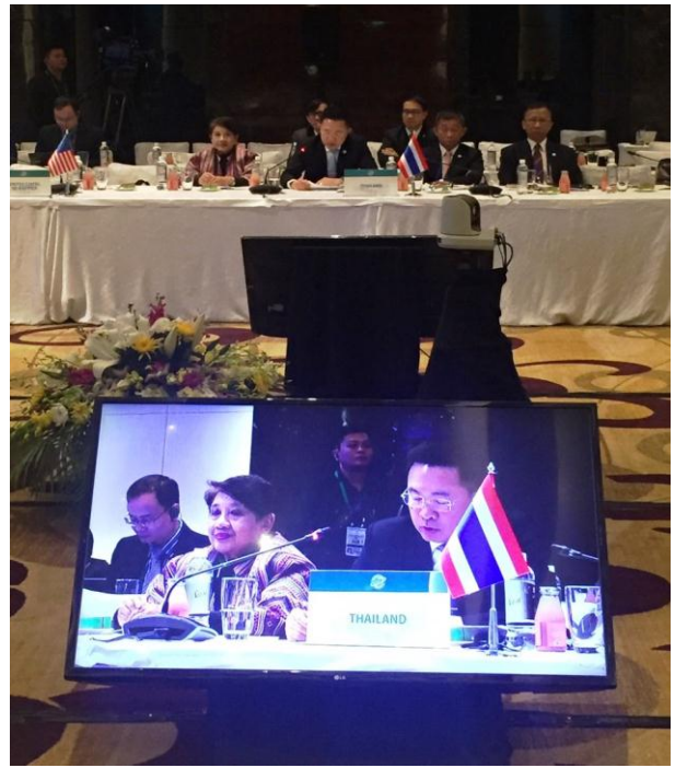
พลเอก สุรพงษ์ สุวรรณอัตถ์ กล่าวถ้อยแถลงในการประชุมเต็มคณะ วาระที่ ๑ ด้านการเมืองและความมั่นคง