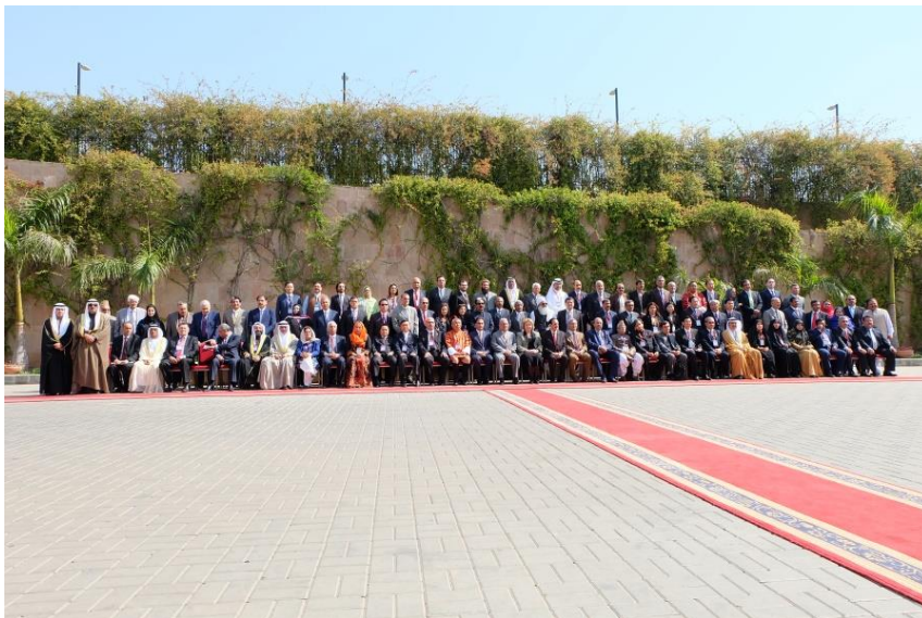
คณะผู้แทนรัฐสภาสมาชิกถ่ายภาพหมู่ร่วมกัน