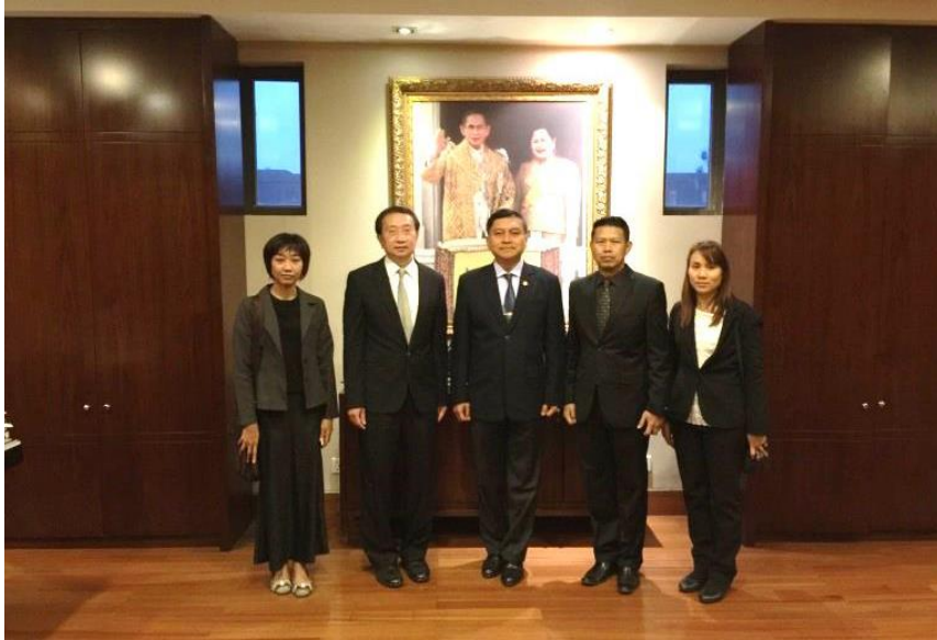
คณะผู้แทนฯ เข้าเยี่ยมชมสถานเอกอัครราชทูต ณ กรุงอิสลามาบัด