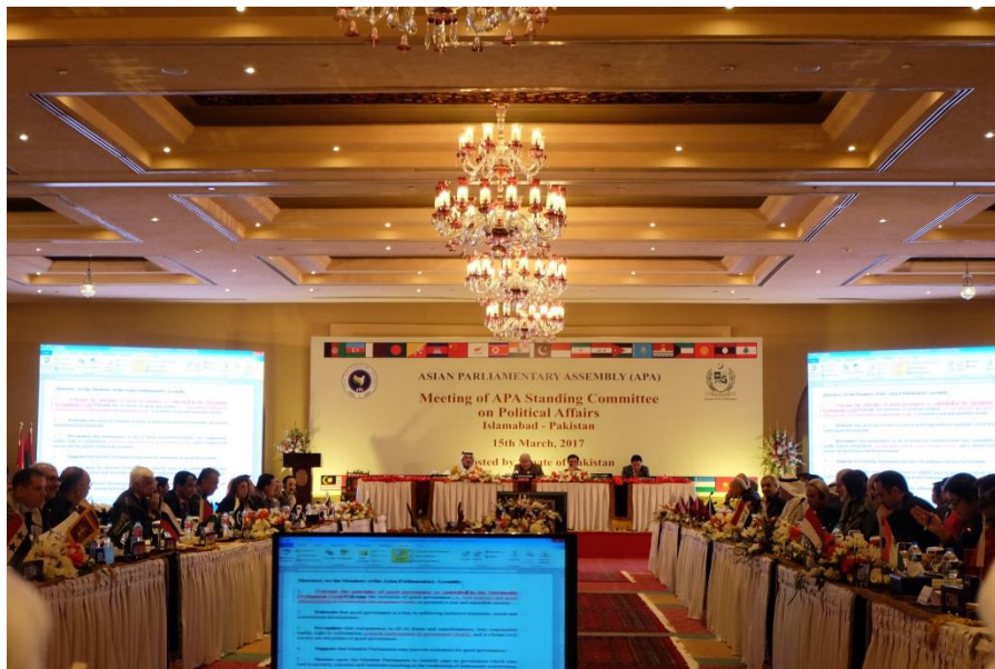
บรรยากาศการประชุมคณะกรรมการว่าด้วยการเมือง

การเมืองที่สำคัญในเอเชีย (Draft Resolution on Significant Political Developments in Asia) และ ๕) ร่างข้อมติว่าด้วยการคัดค้านการก่อการร้ายและการนิยมความรุนแรงอย่างสุดขีด (Draft Resolution on Deploring Acts of Terrorism and Violent Extremism)