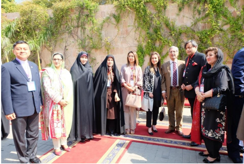
คณะผู้แทนพบกับผู้แทนรัฐสภาสมาชิก