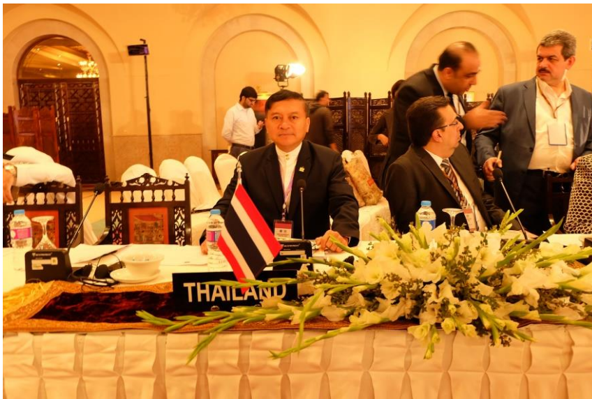
พลเอก นิพัทธ์ ทองเล็ก สมาชิกสภานิติบัญญัติแห่งชาติ ระหว่างการเข้าร่วมประชุมฯ

ภายหลังพิธีเปิดการประชุมฯ เสร็จสิ้นแล้ว การประชุมคณะกรรมการพิเศษว่าด้วยการก่อตั้งรัฐสภาเอเชียเริ่มขึ้นอย่างเป็นทางการ โดยพลเอก นิพัทธ์ ทองเล็ก สมาชิกสภานิติบัญญัติแห่งชาติ และหัวหน้าคณะผู้แทนสภานิติบัญญัติแห่งชาติ พร้อมด้วยนายสุชาติ เลียงแสงทอง เอกอัครราชทูตไทยประจำปากีสถาน พร้อมคณะฯ ได้เข้าร่วมประชุมดังกล่าว