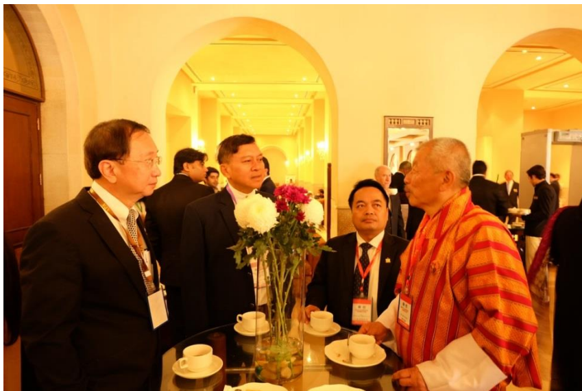
คณะผู้แทนพบปะกับผู้แทนรัฐสภาสมาชิก

นอกเหนือจากการทำหน้าที่ผู้แทนจากสถานิติบัญญัติแห่งชาติในการเข้าร่วมประชุม คณะกรรมการพิเศษว่าด้วยการเมืองและการประชุมคณะกรรมการพิเศษว่าด้วยการก่อตั้งรัฐสภาเอเชียแล้ว หัวหน้าคณะผู้แทนฯ ยังได้พบปะพูดคุยอย่างไม่เป็นทางการกับผู้แทนรัฐสภาสมาชิกที่เข้าร่วมการประชุมฯ ซึ่งถือเป็นการกระชับความสัมพันธ์และมิตรภาพกับรัฐสภาสมาชิก