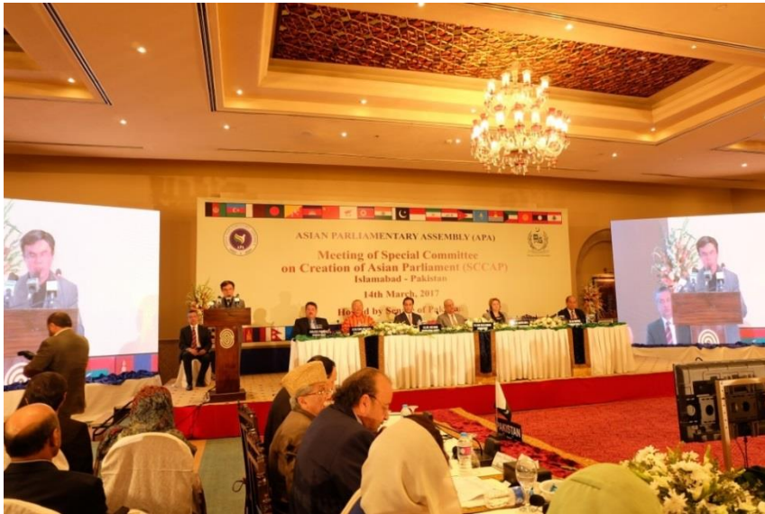
ช่วงพิธีเปิดการประชุม

ปากีสถานที่ได้ริเริ่มแนวคิดนี้อย่างจริงจังและขอเชิญชวนให้รัฐสภาสมาชิกได้มีส่วนร่วมเพื่อบรรลุเป้าหมายนี้ด้วย นอกจากนี้ เอเชียกำลังเผชิญกับความท้าทายต่าง ๆ โดยเฉพาะอย่างยิ่งคตินิยมที่รุนแรง ซึ่งเราควรตระหนักถึงความเห็นพ้องร่วมกันที่จะทำให้เกิดวิธีแก้ไขปัญหามากกว่าการดำเนินด้วยการยอมรับความหลากหลายทางวัฒนธรรม ซึ่งตนเชื่อมั่นว่าสมัชชารัฐสภาเอเชียสามารถส่งเสริมความเข้าใจในมุมมองที่กว้างขึ้นต่อประเด็นต่าง ๆ รวมถึงสร้างมาตรการที่เชื่อมั่น และการต่อต้านการก่อการร้าย คตินิยมที่รุนแรง และนิยกายนิยม โดยการประชุมครั้งนี้จะได้มีการอภิปรายถึงสาระสำคัญของรัฐสภาเอเชียและจะแบ่งหน้าที่ความรับผิดชอบของรัฐสภาสมาชิกออกเป็น ๕ กลุ่มอนุภูมิภาค รวมทั้งจะมีการอภิปรายเพื่อให้การรับรองร่างข้อมติ จำนวน ๘ ฉบับ ซึ่งหวังว่าการประชุมในครั้งนี้จะบรรลุผลสำเร็จโดยมีการนำเสนอแนวคิดที่ดีและมีการอภิปรายกันอย่างสร้างสรรค์