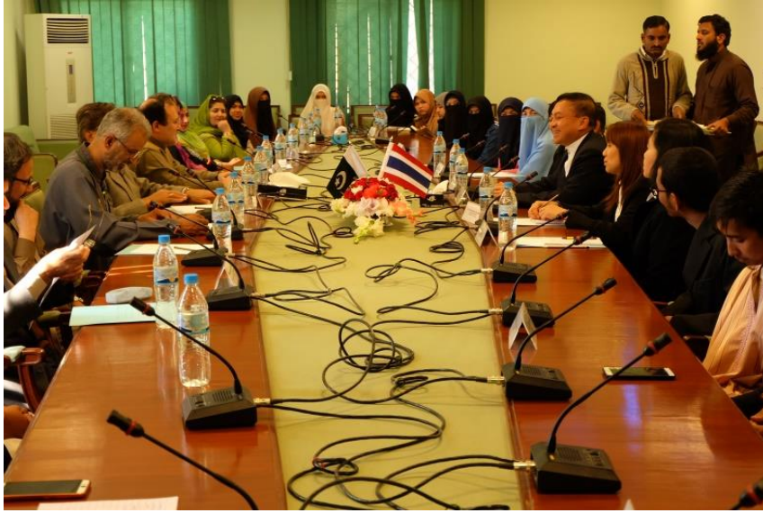
พลเอก นิพัทธ์ ทองเล็ก ระหว่างพบปะพูดคุยร่วมกับนักศึกษาไทยและผู้บริหารมหาวิทยาลัย

ทั้งนี้ ปัญหาที่นักศึกษาประสงค์อยากให้ความช่วยเหลือ ได้แก่ การผ่อนผันการเกณฑ์ทหาร การขอรับเงินสนับสนุนทางการศึกษาและกิจกรรม ปัญหาจากตำรวจตรวจคนเข้าเมืองของไทยทำให้การเดินทางมาศึกษาล่าช้า ปัญหาการอยู่อาศัยหอพักในมหาวิทยาลัย ปัญหาการขอหนังสือรับรองความประพฤติ เป็นต้น พร้อมกันนี้ ฝ่ายผู้บริหารมหาวิทยาลัยได้พูดคุยถึงแนวทางการเรียนการสอนของมหาวิทยาลัยที่เป็นไปตามหลักคำสอนของศาสนาอิสลามและขอยืนยันว่าสถาบันแห่งนี้ไม่เกี่ยวข้องกับการก่อเหตุรุนแรงใด ๆ รวมทั้งได้เชิญชวนให้นักเรียนไทยเดินทางเข้ามาศึกษาที่มหาวิทยาลัยมากขึ้น