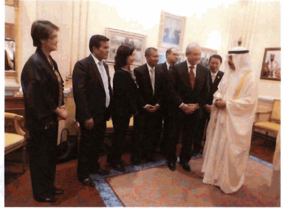
๓.๔ พบปะสนทนากับผู้แทนชุมชนชาวไทย และเอกอัครราชทูต ณ กรุงมานามา เมื่อวันที่ ๓๐ กันยายน ๒๕๕๕ เวลา ๑๕.๐๐ นาฬิกา ณ สถานเอกอัครราชทูต ณ กรุงมานามา