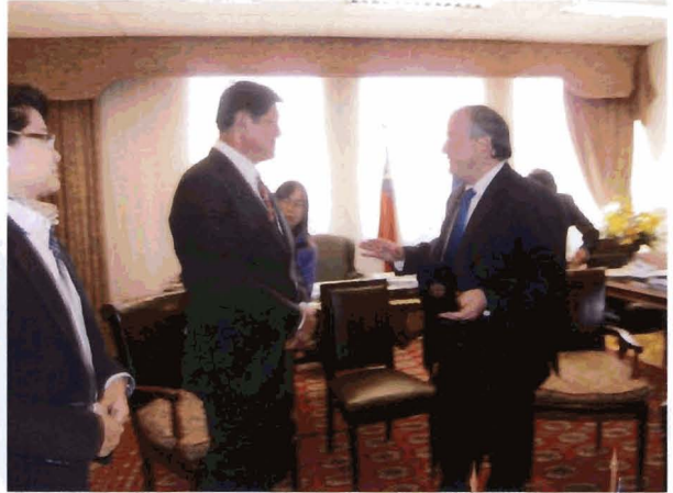
หลังจากนั้น คณะฯ ได้สังเกตการณ์การประชุมรัฐสภาสาธารณรัฐชิลี