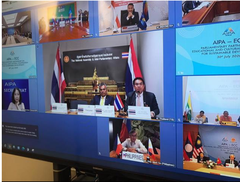
ผู้แทนรัฐสภาไทยแสดงความคิดเห็นเพิ่มเติมในช่วงถาม-ตอบ