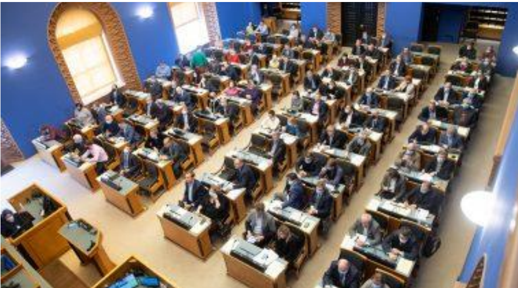
บรรยากาศการประชุมรับรองพระราชบัญญัติเงินทุนในการกระตุ้นเศรษฐกิจเพื่อรับมือกับการระบาดของ โรคโควิด-19