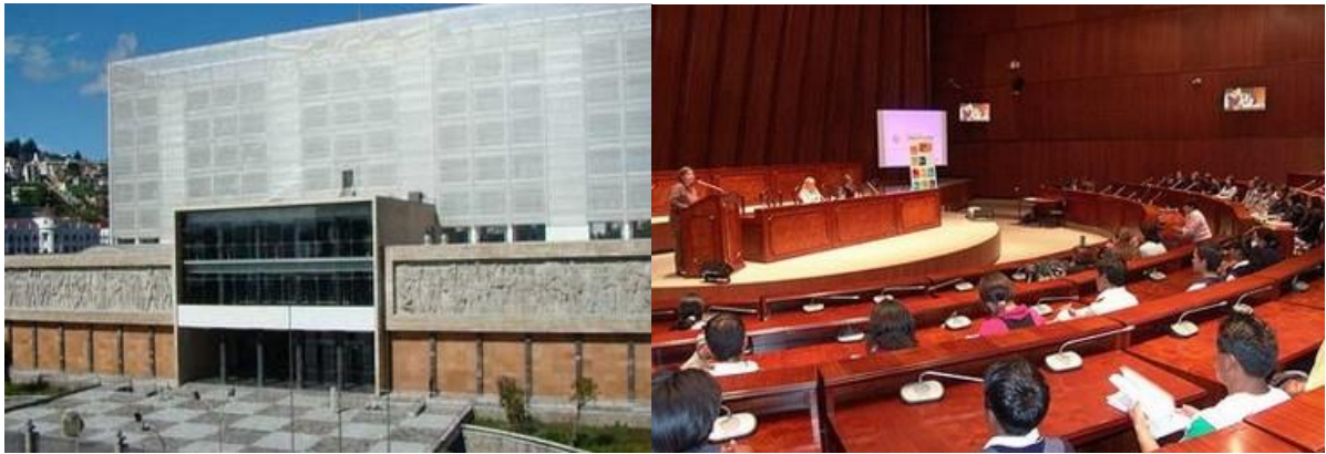
อาคารรัฐสภาและห้องประชุมรัฐสภาสาธารณรัฐเอกวาดอร์

นอกจากนี้ ทุกภาคส่วนยังได้เรียกร้องให้รัฐบาลได้ร่วมมือกับประเทศต่าง ๆ ในละตินอเมริกา กลุ่มประเทศแถบแคริบเบียน และองค์การนาารัฐอเมริกา (Organization of American States : OAS) ในการปักชำระหนั