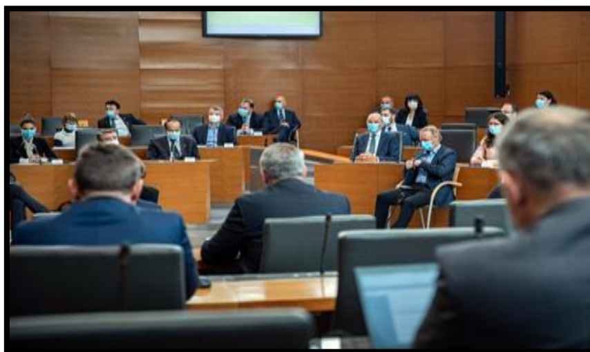
บรรยากาศการประชุมของสภาสโลวีเนีย ช่วงการระบาดของเชื้อไวรัสโคโรนา (COVID-19)

พนักงานส่วนใหญ่ของสภานิติบัญญัติแห่งชาติ ทำงานจากระยะไกลยกเว้นพนักงานหลักและพนักงานที่มีความจำเป็นในการสนับสนุนงานให้การดำเนินงานของรัฐสภาเป็นไปด้วยความราบรื่น