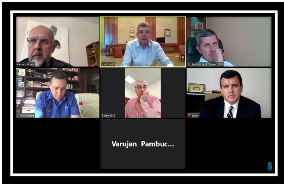
ภาพข่าว การหารือของผู้นำพรรคการเมืองของโรมาเนีย

รัฐสภาโรมาเนียจัดให้มีการประชุมรัฐสภาและการประชุมคณะกรรมการ ผ่านระบบการประชุมทางไกล (VDO Conference) มีการแก้ไขคำสั่งของวุฒิสภาให้รัฐสภานั้นสามารถจัดให้มีการประชุมทางไกลได้ เพื่อให้สอดคล้องกับสถานการณ์พิเศษ รวมถึงสถานการณ์โรคระบาด การแพร่กระจายของโรคระบาด ปรากฏการณ์ทางธรรมชาติที่รุนแรง และการก่อการร้าย เมื่อสมาชิกรัฐสภาไม่สามารถอยู่ในห้องประชุมของการประชุมต่าง ๆ ที่เกี่ยวข้องของรัฐสภาได้ รัฐสภาโรมาเนียจะจัดให้มีการประชุมผ่านระบบการประชุมทางไกล (VDO Conference) โดยจะมีการถ่ายทอดสดในเว็บเพจของวุฒิสภาโรมาเนียและจะมีการลงมติผ่านทางโทรศัพท์