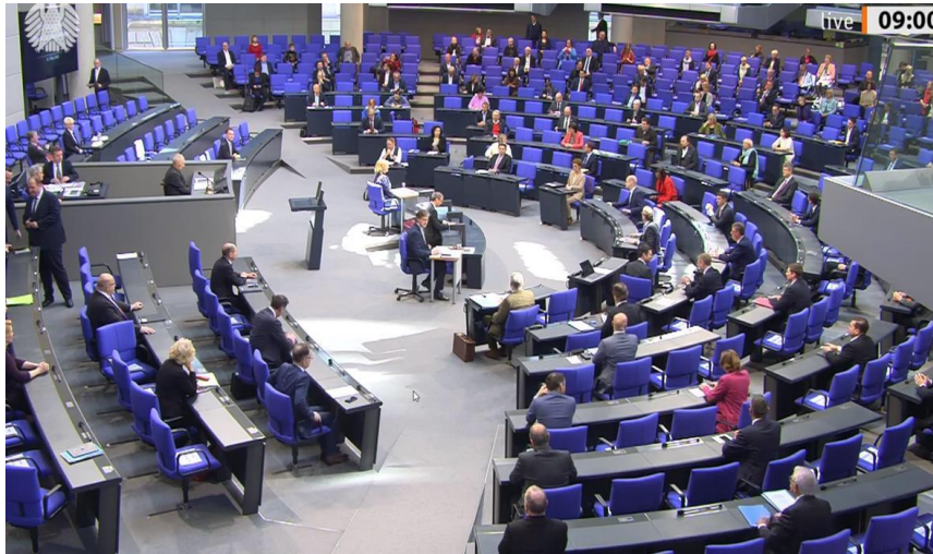
การประชุมสภาผู้แทนราษฎรเยอรมันเมื่อวันที่ ๒๕ มีนาคม ๒๕๖๓