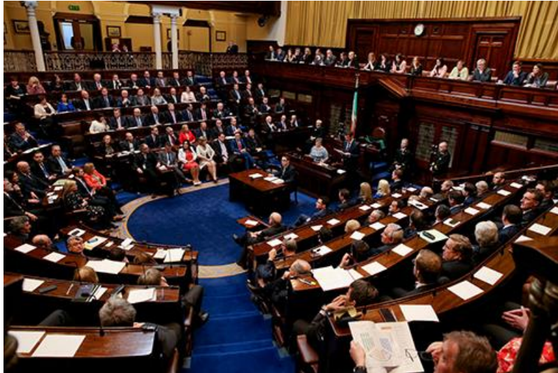
ห้องประชุมสภาผู้แทนราษฎรไอร์แลนด์

ไอร์แลนด์มีการเลือกตั้งเมื่อวันที่ ๘ กุมภาพันธ์ ๒๕๖๓ และอยู่ในระหว่างกระบวนการจัดตั้งรัฐบาล เป็นภาวะปกติที่ในช่วงเวลานี้จะมีการประชุมค่อนข้างน้อย ทั้ง ๒ สภาได้ผ่านพระราชกำหนดฉุกเฉินไปเมื่อปลายเดือนมีนาคม