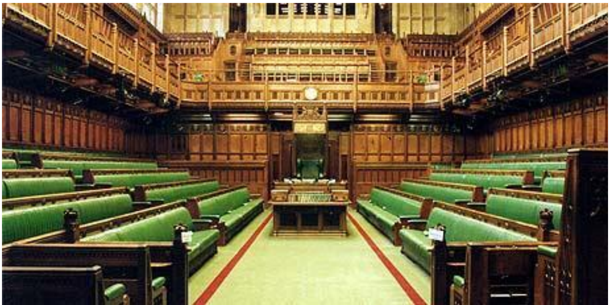
ภาพถ่ายของรัฐสภาสหราชอาณาจักรหลังจากมีมาตรการให้สมาชิกรัฐสภาและข้าราชการปฏิบัติงานทางไกล

รัฐสภาสหราชอาณาจักรได้ออกมาตรการการปฏิบัติงานภายใต้วิกฤติการแพร่ระบาดของเชื้อไวรัสโคโรนา (COVID-19) ดังนี้