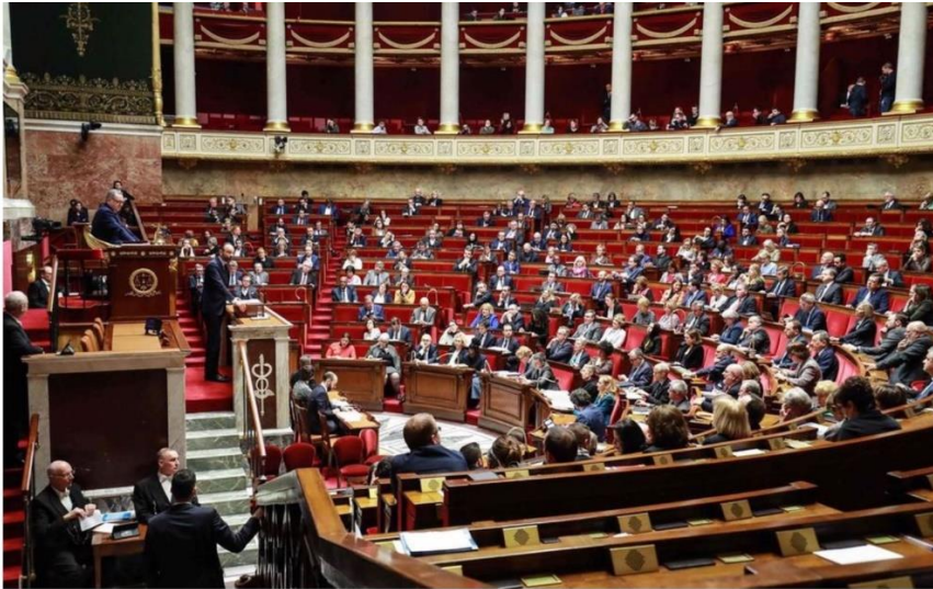
Les 577 députés, dont cinq qui sont contaminés au coronavirus, ne siègent pas pendant quinze jours en raison de la campagne des municipales

การประชุมพิจารณางบประมาณสภาผู้แทนราษฎรฝรั่งเศส วันที่ ๑๘ เมษายน ๒๕๖๓ มีสส. เข้าร่วมประชุม ๕๗๗ คน และสส. ไม่มาประชุม ๕ คนเนื่องจากต้องกักตัว ๑๕ วันเพราะลงพื้นที่หาเสียงสภาท้องถิ่น