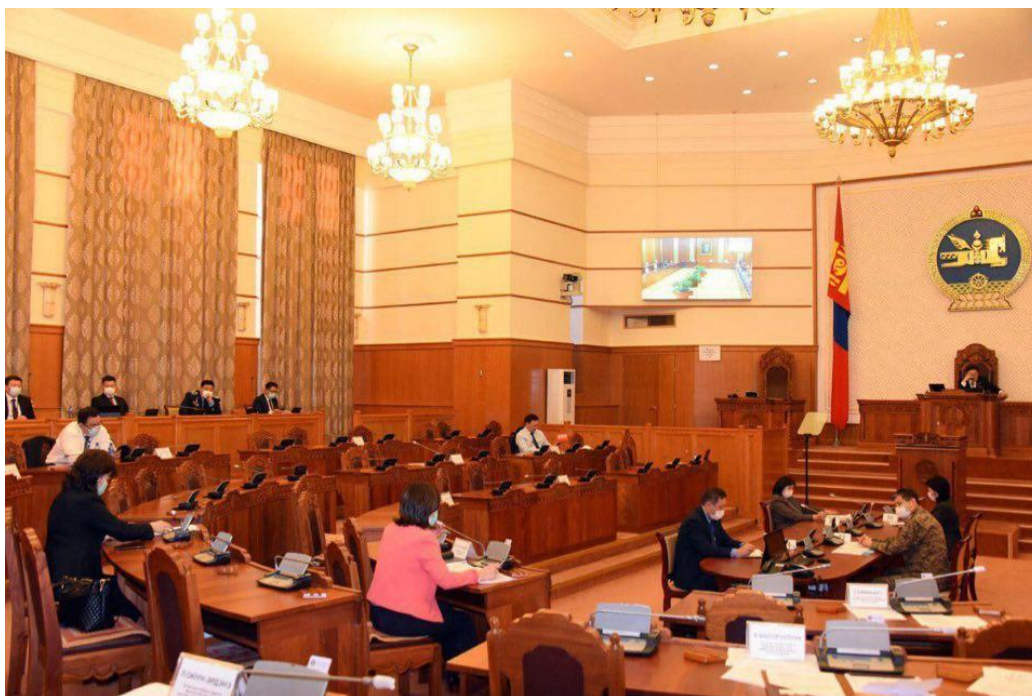
การประชุมของรัฐสภามองโกเลียในช่วงการแพร่ระบาด COVID-19 ที่มา : เฟซบุ๊กของรัฐสภามองโกเลีย

(๓) การบังคับใช้กฎหมายในกรณีที่ไม่ปฏิบัติตามกระบวนการ ยกตัวอย่างเช่น สมาชิกรัฐสภาใดที่ฝ่าฝืนกระบวนการมากกว่าหนึ่งครั้ง ประธานจะทำการเพิกถอนสิทธิของสมาชิกรัฐสภาคนดังกล่าวในการตั้งคำถาม การแสดงความคิดเห็น หรือการมีส่วนร่วมในการรับฟัง โดยจะโพสต์ลงในซอฟต์แวร์พื้นที่สาธารณะเป็นเวลา ๓ ชั่วโมง หรือตลอดระยะเวลาที่มีประชุมรัฐสภาตลอดวัน นอกจากนี้ ประธานรัฐสภายังได้มีการออกกฎหมายเพื่ออนุญาตให้ตัวแทนของสื่อได้ทำงานในอาคารรัฐสภาชั่วคราวในพื้นที่ของสื่อมวลชนที่จัดไว้โดยเฉพาะ