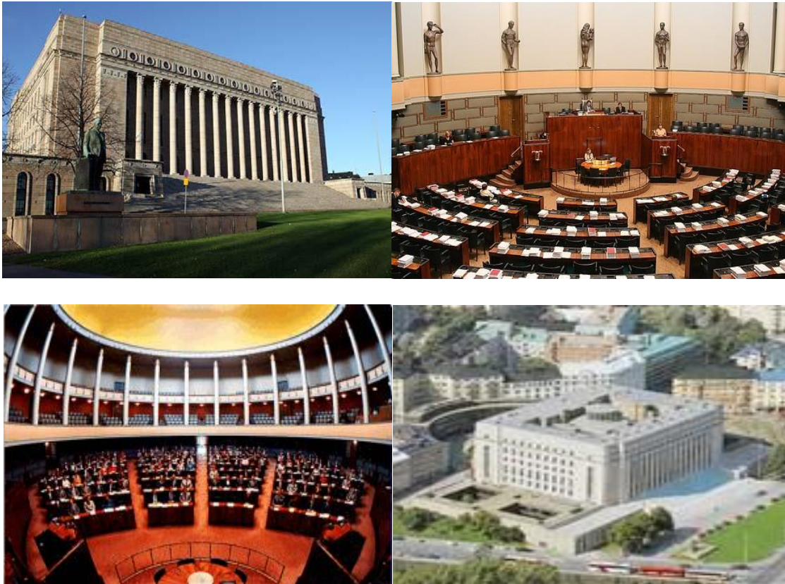
อาคารรัฐสภาและห้องประชุมรัฐสภาสาธารณรัฐฟินแลนด์

นอกเหนือจากมาตรการการปรับลดจำนวนการประชุมที่กล่าวมาข้างต้นแล้ว รัฐสภาสาธารณรัฐฟินแลนด์ ยังมีการจัดวางที่นั่งในห้องประชุมโดยจัดเก้าอี้แยกห่างกันสำหรับรัฐมนตรี จำกัดจำนวนสมาชิกของกลุ่มการเมืองที่เข้าร่วมในการประชุมที่เป็นการตั้งกระทู้ถาม การประชุมทางไกล การเสนอกฎหมายสามารถนำเสนอผ่านระบบดิจิทัล (แต่ไม่สามารถลงคะแนนเสียงรับรองกฎหมายได้) เป็นต้น (สำนักภาษาต่างประเทศ, มาตรการการปฏิบัติงานของรัฐสภาทั่วโลกในช่วงการระบาดของโรคติดเชื้อไวรัสโคโรนา 2019 (COVID-19))