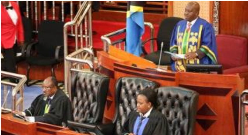
การประชุมของรัฐสภาสหสาธารณรัฐแทนซาเนีย

รัฐสภาสหสาธารณรัฐแทนซาเนียได้ออกมาตรการการปฏิบัติงานภายใต้วิกฤติการแพร่ระบาดของโคโรนาไวรัส (COVID-19) ดังนี้