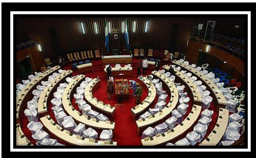
ห้องประชุมสภาสาธารณรัฐเซียร์ราลีโอน