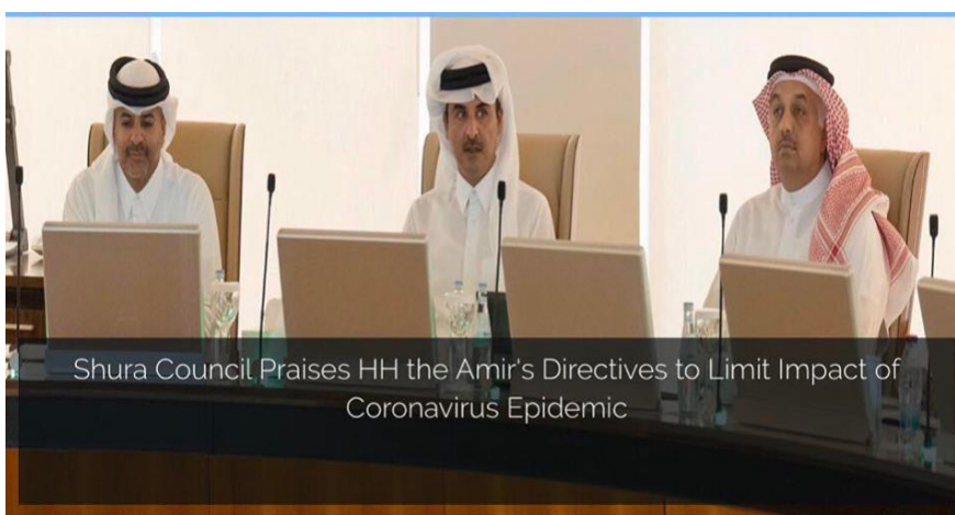
ภาพการประชุมสภาที่ปรึกษาของกาตาร์เพื่อออกมาตรการการแพร่ระบาดของเชื้อไวรัสโคโรนา (COVID-19)

สภาที่ปรึกษา (Shura Council) ของกาตาร์ได้ให้คำแนะนำและข้อเสนอแนะต่อรัฐบาลเพื่อป้องกันการแพร่ระบาดของโรค รวมไปถึงสภาที่ปรึกษาได้ทำการฆ่าเชื้อห้องทำงานและห้องประชุมทุกห้อง และได้ออกมาตรการเว้นระยะห่างทางสังคม นอกจากนี้ ยังได้จำกัดจำนวนเจ้าหน้าที่ที่ปฏิบัติงานในอาคารรัฐสภาและกำหนดให้เจ้าหน้าที่ที่ไม่มีภารกิจจำเป็นทำงานอยู่ที่บ้าน