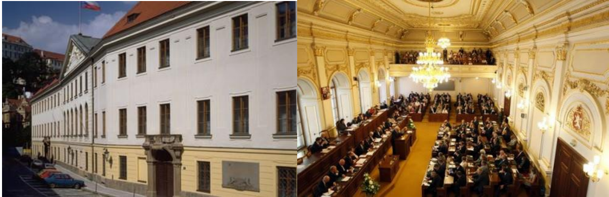
อาคารรัฐสภาและห้องประชุมรัฐสภาสาธารณรัฐเช็ก

การประชุมสมัชชาของสาธารณรัฐเช็กขณะนี้ยังไม่ได้อยู่ในสมัยประชุม การประชุมคณะกรรมการธิการต่าง ๆ ได้ลดลงและบางการประชุมได้ยกเลิก และเหลือการประชุมทางไกลเพียงเล็กน้อย โดยขณะนี้ยังไม่มีกรอบการทำงานตามกฎหมายในการจัดการประชุมทางไกล โดยการจัดการประชุมจะจัดขึ้นภายใต้ระเบียบการประชุมของรัฐสภา ในส่วนของการการลงคะแนนทางไกลจะต้องลงคะแนนอย่างเปิดเผย โดยนำซอฟต์แวร์ Webex มาใช้ในการจัดการประชุมภายในรัฐสภา