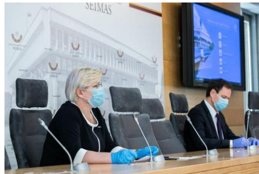
การประชุมคณะกรรมการลิทัวเนียที่ สส. ใส่หน้ากากและถุงมือรวมถึงรักษาระยะห่างในการประชุม มีการจำกัดการประชุมรัฐสภา (Seimas)