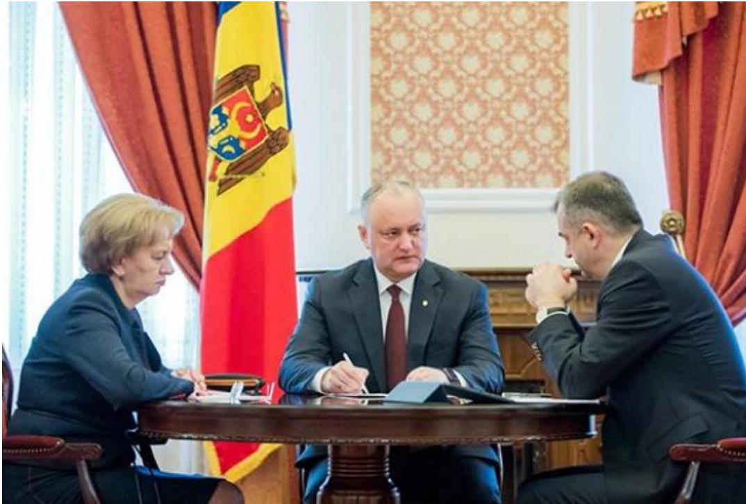
นาย Igor Dodon ประธานาธิบดีแห่งสาธารณรัฐมอลโดวา (ภาพกลาง) ระหว่างการสรุปสถานการณ์การแพร่ระบาดของไวรัสโคโรนาพร้อมกับนาย Ion Chicu นายกรัฐมนตรี และนาง Zinaida Greceanii ประธานรัฐสภามอลโดวา

รัฐสภาได้เห็นชอบแผนการป้องกันและปกป้องการแพร่ระบาดของโรค COVID-19 โดยมีมาตรการต่าง ๆ เช่น การปรับเปลี่ยนโครงสร้างองค์กรในการเข้าถึงสถานที่ทำงาน โรงอาหาร ห้องส่วนกลาง การจำกัดจำนวนประชาชนและบุคคลภายนอกในการเข้าถึงอาคารรัฐสภา การเว้นระยะห่างทางสังคม และการกำหนดการเข้าถึงของเจ้าหน้าที่ที่แสดงอาการโรคโควิด-19 นอกจากนี้ ประธานรัฐสภาได้ออกคำสั่งควบคุมโดยตรงในกระบวนการตรวจสอบคำร้องต่าง ๆ และการลงนามในเอกสารโดยใช้ลายเซ็นอิเล็กทรอนิกส์แทนผู้อำนวยการทางด้านเทคโนโลยีสารสนเทศและการสื่อสารได้รับรองความปลอดภัยให้แก่พนักงานในการเข้าถึงระบบฐานข้อมูลรวมของรัฐสภาซึ่งช่วยให้พนักงานสามารถทำงานจากที่บ้านได้