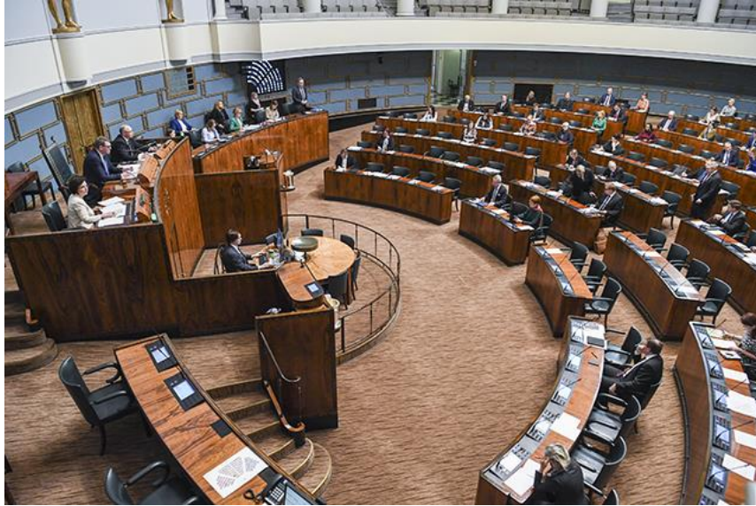
การรักษาระยะห่างในห้องประชุมรัฐสภาสาธารณรัฐฟินแลนด์