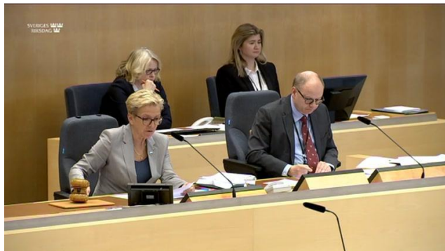
การประชุมของสภาสวีเดน

นอกจากนี้รัฐสภาสวีเดนยังกำหนดจำนวนสมาชิกรัฐสภาจำนวน ๕๕ คนเท่านั้นที่สามารถลงคะแนนเสียงในห้องประชุม ไม่ว่าจะป็นพระราชบัญญัติหรือกฎหมายอื่นใดก็ตามที่บัญญัติให้มีจำนวนสมาชิกรัฐสภาเข้าร่วมลงคะแนนเสียงเพื่อตัดสินใจกเว้นในเรื่องที่ต้องใช้จำนวนที่แน่นอน (ยกตัวอย่างเช่นการเปลี่ยนแปลงแก้ไขรัฐธรรมนูญ) (สำนักภาษาต่างประเทศ, มาตรการการปฏิบัติงานของรัฐสภาทั่วโลกในช่วงการระบาดของโรคติดเชื้อไวรัสโคโรนา 2019 (COVID-19))