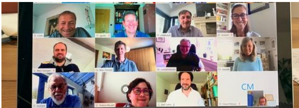
การประชุมทางไกลผ่านจอภาพของสภาผู้แทนราษฎรลักเซมเบิร์ก

สภาผู้แทนราษฎรของลักเซมเบิร์กได้ลดการประชุมต่าง ๆ ลง โดยจัดให้มีการประชุมขึ้นในอาคารรัฐสภาหรือนั่งโดยเว้นระยะห่าง การประชุมร่วมของคณะกรรมการจะไม่มีขึ้นจนกว่าจะแจ้งให้ทราบล่วงหน้า นอกจากนี้ ยังมีการจัดประชุมทางไกลผ่านจอภาพ (VDO Conference) ตามระเบียบของสภาผู้แทนราษฎร ซึ่งการออกเสียงนั้นจะกระทำโดยการเรียกชื่อสมาชิกตามลำดับ ทั้งนี้ สภาผู้แทนราษฎรจะใช้โปรแกรม Cisco Webex ในการจัดประชุมทางไกลของคณะกรรมการต่าง ๆ สำหรับเอกสารนั้นจะส่งผ่านช่องทางอินเทอร์เน็ต ในส่วนของซอฟต์แวร์ที่ใช้จัดประชุมจะดำเนินการโดยผู้ให้บริการภายนอกและระบบฐานข้อมูลออนไลน์