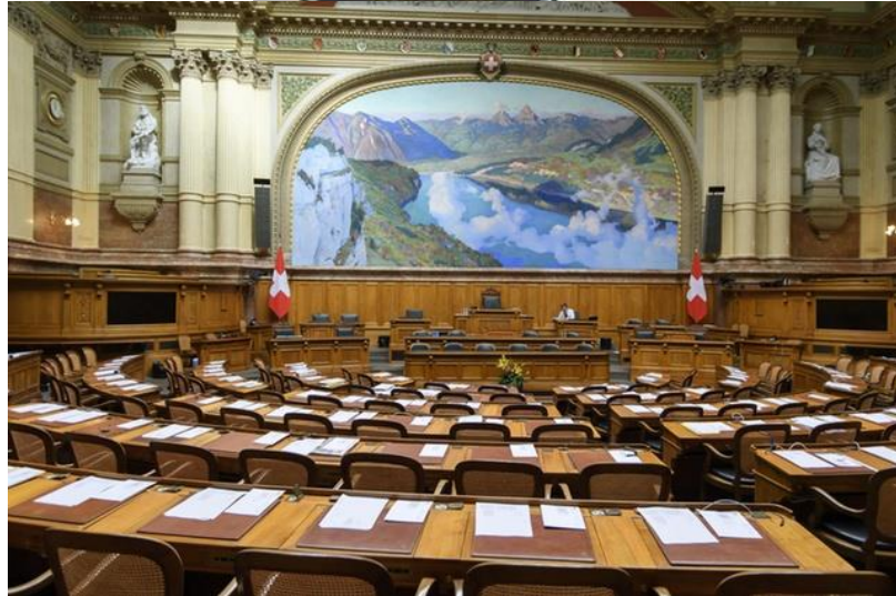
ป้ายรณรงค์การป้องกันไวรัสโคโรนาบริเวณหน้าอาคารรัฐสภาสวิส