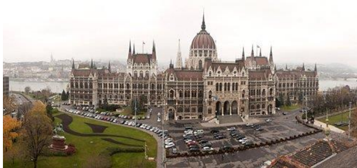
อาคารรัฐสภาฮังการี