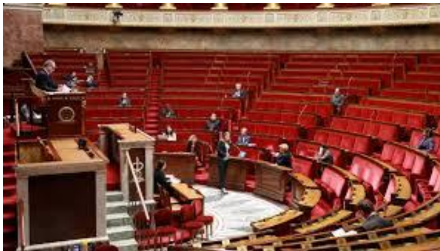
การประชุมสภาผู้แทนราษฎรฝรั่งเศสที่รักษาระยะห่างในช่วงการแพร่ระบาดของไวรัสโควิด-19