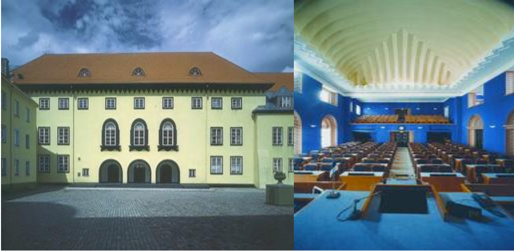
อาคารรัฐสภาและห้องประชุมรัฐสภาสาธารณรัฐเอสโตเนีย