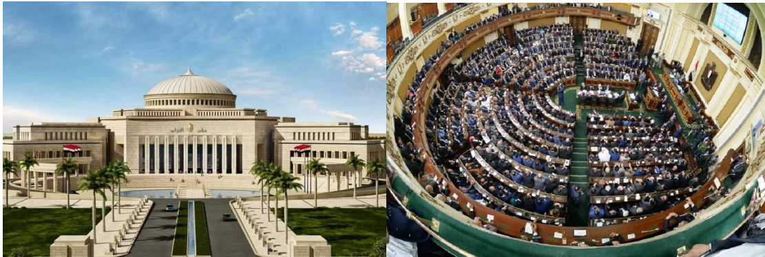
อาคารรัฐสภาและห้องประชุมรัฐสภาสาธารณรัฐอียิปต์

ในส่วนของการประชุมคณะกรรมการต่าง ๆ นั้นได้มีการจำกัดลง อย่างไรก็ตาม คณะกรรมการการยังมีการพิจารณาการศึกษาเรื่องราวร้องทุกข์ของประชาชน และสมาชิกรัฐสภายังคงทำหน้าที่ให้ความช่วยเหลือประชาชนของตนอยู่เช่นเดิม โดยเฉพาะอย่างยิ่ง ประชาชนที่ทำงานและมีรายได้ตามฤดูกาล และประชาชนที่ได้รับผลกระทบต่อมาตรการการรับมือการแพร่ระบาดของโรคโควิด-19 โดยสมาชิกรัฐสภาสามารถประสานโดยตรงกับคณะกรรมการกิจการสภาและคณะรัฐมนตรีที่เกี่ยวข้องเพื่อให้แน่ใจว่ารัฐบาลได้ดำเนินการตามคำแนะนำของรัฐสภาในการรับมือต่อโรคระบาดในครั้งนี้