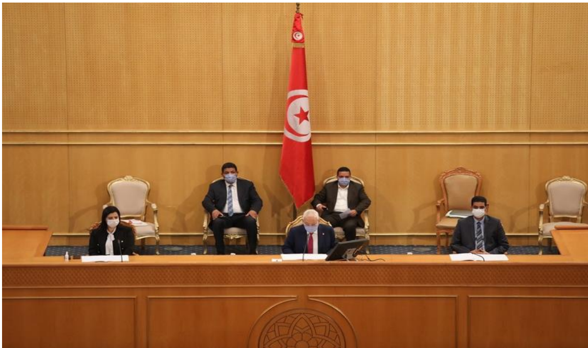
การประชุมสภาผู้แทนราษฎรของตูนิเซียเมื่อวันที่ ๑๔ เมษายน ๒๕๖๓