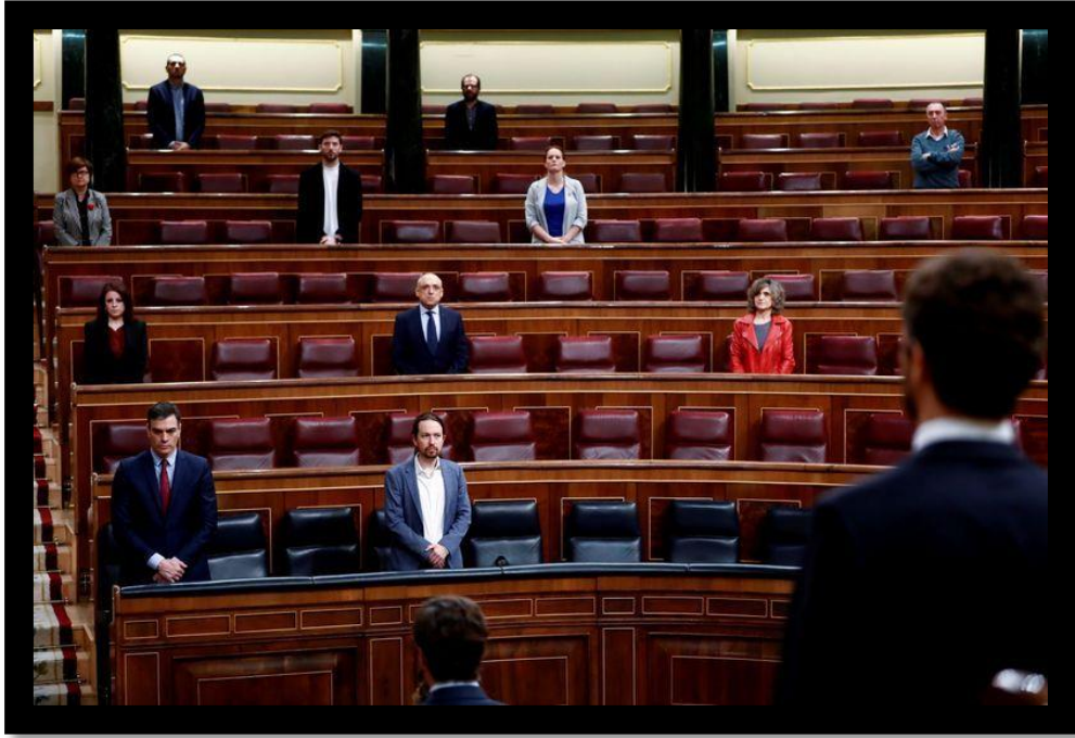
บรรยากาศการประชุมสภาของสเปน ช่วงการระบาดของโควิด-19