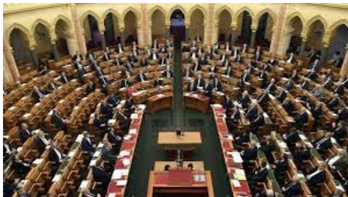
การประชุมสภาฮังการีในการพิจารณากฎหมายใหม่ที่เกี่ยวข้องกับไวรัสโคโรนา