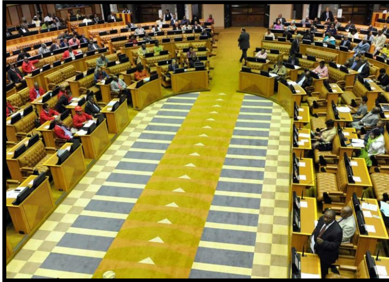
บรรยากาศการประชุมสภาของแอฟริกาใต้

สถานการณ์บัญญัติของแอฟริกาใต้และคณะกรรมการไม่ได้มีการประชุมในช่วงเวลานี้ หลังจากการประกาศของประธานาธิบดีถึงสถานการณ์ภัยพิบัติแห่งชาติ ประธานรัฐสภาและประธานสภาแห่งชาติท้องถิ่น ตัดสินใจที่จะระงับกิจการของรัฐสภาจนกว่าจะมีการออกคำสั่งประกาศ