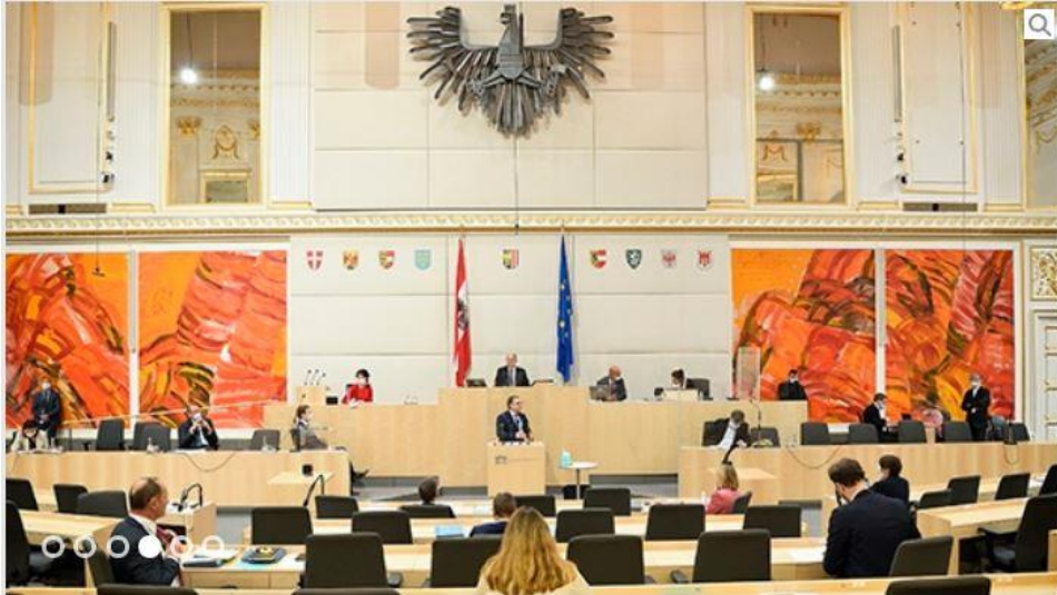
การประชุมสภาผู้แทนราษฎรสาธารณรัฐออสเตรีย

อนึ่ง เมื่อวันที่ ๓ เมษายน ๒๕๖๓ นาย Wolfgang SOBOTKA ประธานสภาผู้แทนราษฎรสาธารณรัฐออสเตรียได้เรียกร้องให้ชาวออสเตรียแสดงความเป็นน้ำหนึ่งใจเดียวกันในการรับมือกับปัญหาการแพร่ระบาดของเชื้อไวรัส โดยประธานสภาผู้แทนราษฎรได้กล่าวว่า สถานการณ์การแพร่ระบาดของเชื้อไวรัสสร้างความสูญเสียอย่างยิ่ง ความร่วมมือร่วมแรงและความเป็นน้ำหนึ่งใจเดียวกันของชาวออสเตรียจะทำให้สาธารณรัฐออสเตรียผ่านพ้นวิกฤตินี้ไปได้อย่างรวดเร็ว