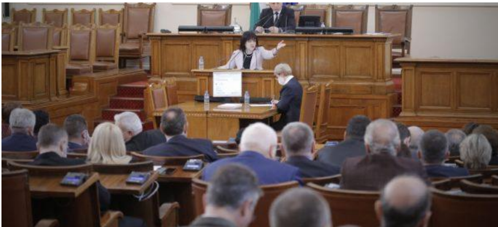
การประชุมรัฐสภาสาธารณรัฐบัลแกเรีย เมื่อวันที่ ๓ เมษายน ๒๕๖๓