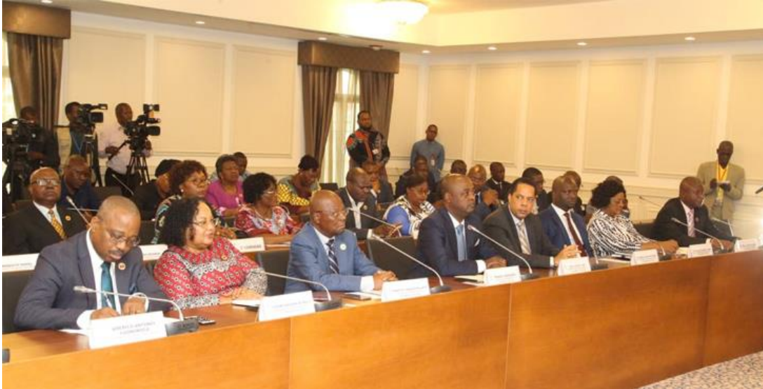
การประชุมสภาผู้แทนราษฎรราชอาณาจักรแอนดอร์รา