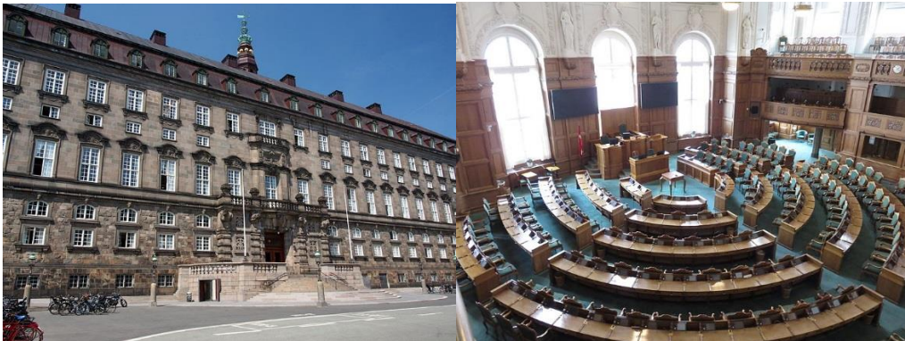
อาคารรัฐสภาและห้องประชุมรัฐสภาราชอาณาจักรเดนมาร์ก

ประธานสภาผู้แทนราษฎรมอบแนวทางการปฏิบัติในการลงมติโดยผ่านเครื่องขยายเสียง ให้สมาชิกรัฐสภาเว้นระยะห่าง ๒ เมตร และสำหรับสมาชิกรัฐสภาที่อยู่ในห้องประชุมสามารถกดปุ่มลงคะแนนเสียง และออกจากห้องประชุมในพื้นที่ที่ลงคะแนนเสร็จแล้ว (โดยจำนวนสมาชิกรัฐสภาในห้องประชุมจะต้องมีไม่เกิน ๑๐ คน) นอกจากนี้ สมาชิกรัฐสภาสามารถทำงานผ่านระบบการสื่อสารออนไลน์ และเจ้าหน้าที่ที่สามารถทำงานที่บ้านได้ (สำนักภาษาต่างประเทศ, มาตรการการปฏิบัติงานของรัฐสภาทั่วโลกในช่วงการระบาดของโรคติดเชื้อไวรัสโคโรนา 2019 (COVID-19))