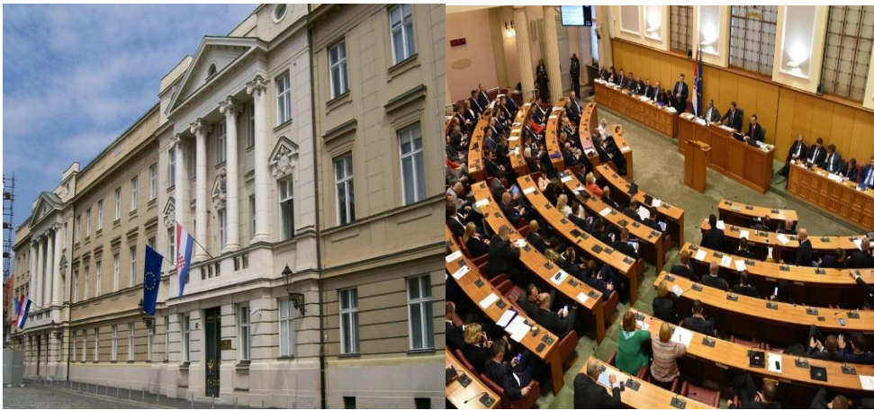
อาคารรัฐสภาและห้องประชุมรัฐสภาสาธารณรัฐโครเอเชีย

ในส่วนของมาตรการด้านสุขอนามัย โครเอเชียใช้มาตรการการรักษาระยะห่าง การรักษาสุขอนามัย และความสะอาดของมือ การจัดวางที่นั่ง โปรแกรมไมโครซอฟต์และโปรแกรมเวิร์ดถูกนำมาใช้ในการประชุมทางไกล รวมถึงการติดตามงานด้านเอกสาร และมีการนำซอฟต์แวร์ด้านการประชุมภายในของรัฐสภา