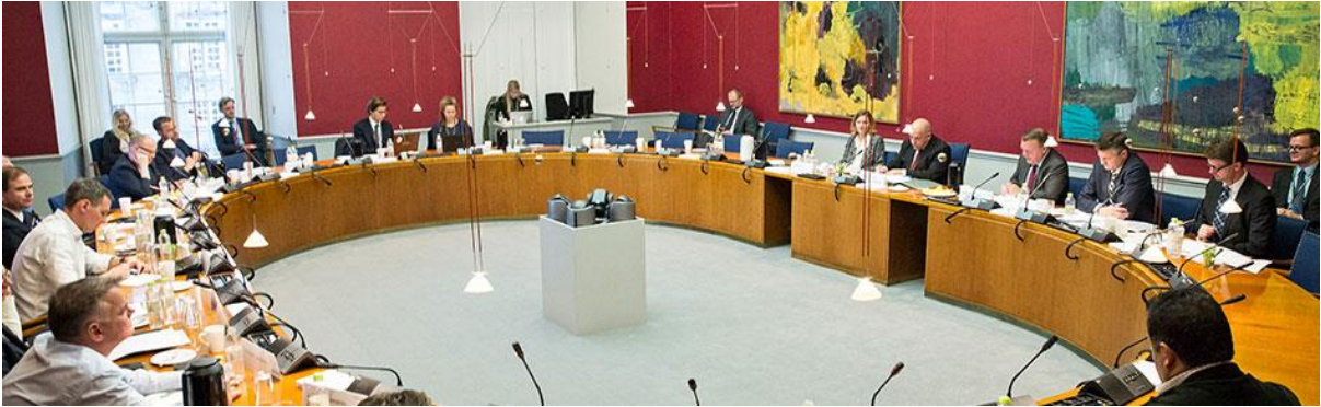
การประชุมคณะกรรมการของรัฐสภาราชอาณาจักรเดนมาร์ก