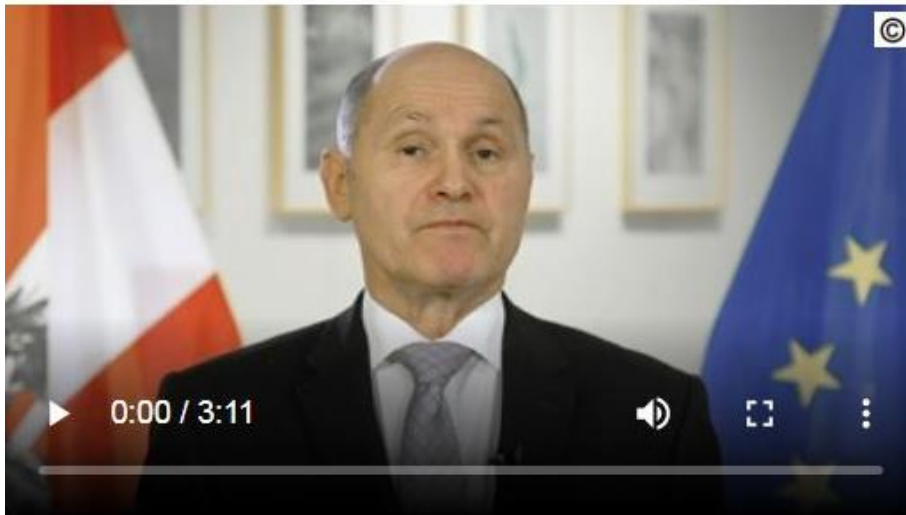
นาย Wolfgang SOBOTKA ประธานสภาผู้แทนราษฎรรัฐสภาสาธารณรัฐออสเตรีย