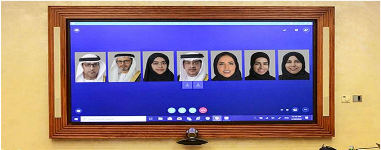
การประชุมทางไกลของคณะกรรมการการศึกษาหารือกับเจ้าหน้าที่ในเรื่อง "ระบบการศึกษาทางไกล"