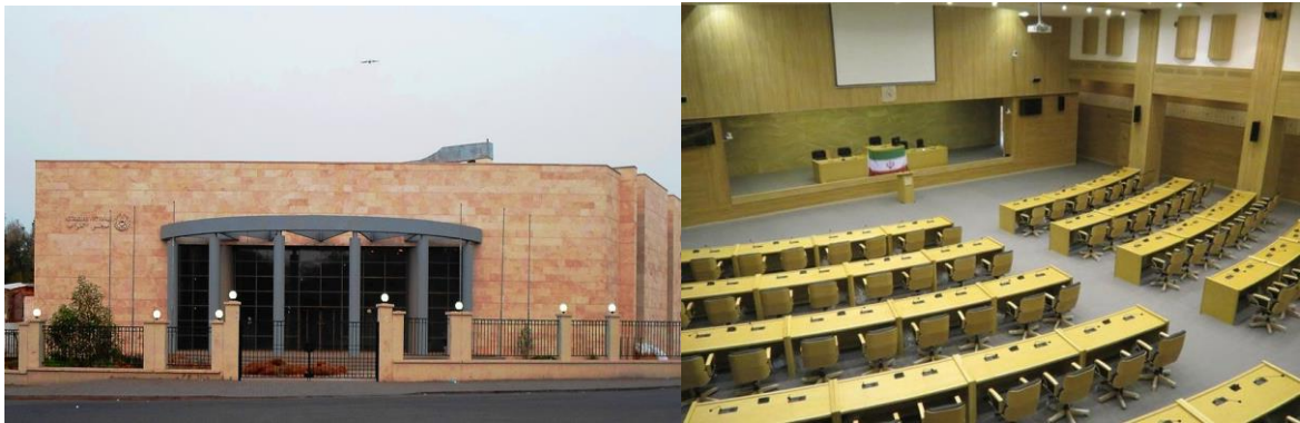
อาคารรัฐสภาและห้องประชุมรัฐสภาสาธารณรัฐจิบูตี

รัฐสภาสาธารณรัฐจิบูตีได้จัดตั้งคณะกรรมการเฉพาะกิจเมื่อวันที่ ๕ เมษายน ๒๕๖๓ เพื่อสนับสนุนและติดตามงานของคณะกรรมการในการต่อสู้กับโรคโควิด-19 คณะกรรมการจะมีการประชุมเป็นไปตามแนวปฏิบัติขององค์การอนามัยโลก (WHO) เพื่อสุขอนามัยและคำแนะนำทางด้านการแพทย์ ทั้งนี้ ตามข้อบังคับข้อที่ ๖ ของรัฐสภา ประธานรัฐสภาสามารถเรียกประชุมเพื่อกำหนดกรอบการทำงานที่เหมาะสมในช่วงที่มีโรคระบาด ตัวอย่างเช่น การลงคะแนนในพระราชบัญญัติที่เร่งด่วนหรือกรณีโรคระบาด และควบคุมผ่านฝ่ายบริหาร สำหรับกิจกรรมอื่น ๆ ขณะนี้ยังพักการดำเนินการไว้ก่อนจนกว่าจะมีการเปลี่ยนแปลง