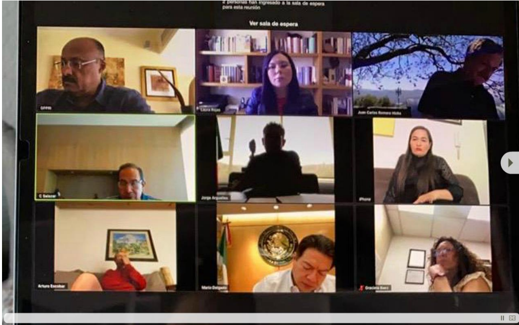
การประชุมทางไกลผ่านจอภาพของสภาผู้แทนราษฎรเม็กซิโก เมื่อวันที่ ๒๔ มีนาคม ๒๕๖๓

อย่างไรก็ดี คณะกรรมการปกครองของสภาผู้แทนราษฎร (ประกอบด้วยคณะกรรมการบริหารและผู้บริหารพรรคการเมือง) ได้เห็นพ้องที่จะดำเนินการกิจกรรมตามปกติเพื่อประเมินสถานการณ์ของประเทศเป็นรายวัน โดยในช่วงระหว่างพักการประชุมสถานั้น สมาชิกสภาผู้แทนราษฎรจะสามารถบรรจุร่างพระราชบัญญัติและข้อเสนอแนะที่ไม่เกี่ยวกับกฎหมายได้ ในขณะที่คณะกรรมการว่าด้วยการพิจารณากฎหมายได้รับการร้องขอให้ดำเนินการตามภารกิจโดยให้อำนาจในการเสนอข้อคิดเห็นทางด้านกฎหมายนั้น คณะกรรมการบริหารของสภาได้สั่งให้เลื่อนกำหนดการพิจารณากฎหมายทุกฉบับออกไปในระหว่างที่เกิดเหตุการณ์การระบาดของโรคนี้และอนุญาตให้มีการคุ้มครองทางกฎหมายในทุกกระบวนการในช่วงระหว่างการรอลงมติของสภาผู้แทนราษฎร