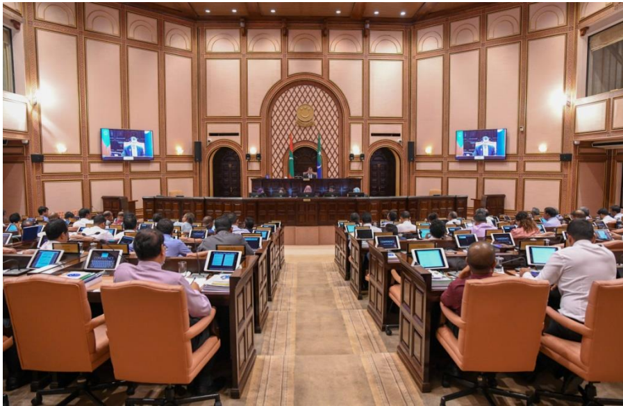
การจัดประชุมทางไกลผ่านจอภาพครั้งแรกของรัฐสภามัลดีฟส์

แม้ว่ามัลดีฟส์จะมีมาตรการการเดินทางอย่างเข้มงวดและไม่ออกไปข้างนอกโดยไม่จำเป็น แต่รัฐสภามัลดีฟส์ได้จัดประชุมทางไกลผ่านจอภาพอย่างต่อเนื่อง โดยสมาชิกรัฐสภาจะเข้าร่วมประชุมทางไกลอยู่ที่บ้าน โดยได้มีการจัดประชุมทางไกลผ่านจอภาพครั้งแรกเมื่อวันที่ ๓๐ มีนาคม ๒๕๖๓ และมีสมาชิกรัฐสภาเข้าร่วมประชุม จำนวน ๗๑ คน จากสมาชิกรัฐสภาทั้งหมด ๘๗ คน ซึ่งสมาชิกรัฐสภาได้มีการอภิปรายเกี่ยวกับโครงการสนับสนุนทางการเงินตามข้อเสนอของรัฐบาลตามที่ประเทศมัลดีฟส์ได้รับผลกระทบทางเศรษฐกิจและสังคมจากการแพร่ระบาดของเชื้อไวรัสโคโรนา (COVID-19)