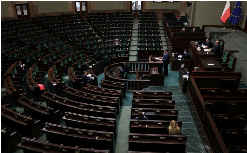
ภาพข่าวการประชุมรัฐสภาโปแลนด์เกี่ยวกับการแพร่ระบาดของไวรัสโคโรนา เมื่อวันที่ ๑๕ เมษายน ๒๕๖๓

สาริตเกี่ยวกับการเชื่อมต่อเข้าร่วมประชุมและการแสดงตนผ่านข้อความ ซึ่งขณะที่ผู้แทนพำนักอยู่ที่บ้านนั้นจะสามารถตั้งกระทู้ถามและแสดงความคิดเห็นได้ รวมทั้งได้มีจอแสดงการถ่ายทอดสัญญาณไว้บนผนังของห้องประชุมทั้งสองด้าน