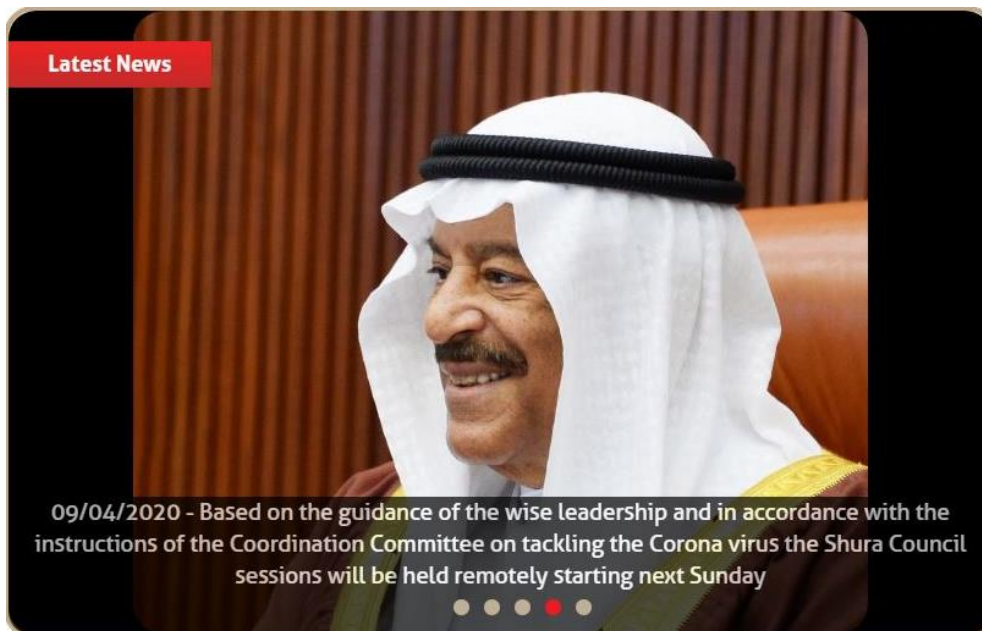
นาย Ali Bin Saleh Al-Saleh ประธานสภาที่ปรึกษา (ประธานวุฒิสภา)