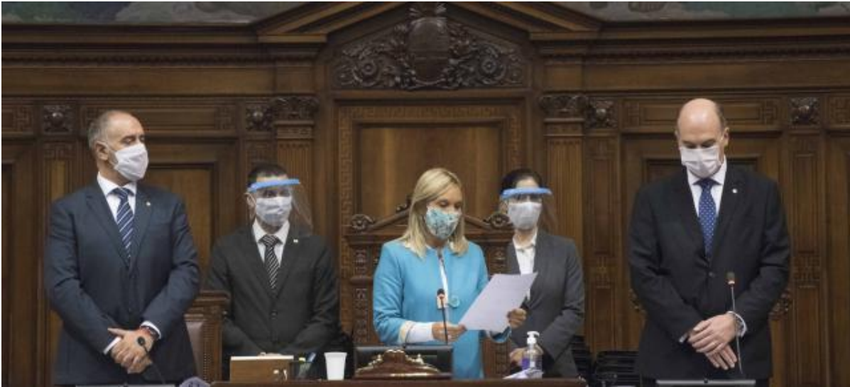
การประชุมของรัฐสภาสาธารณรัฐบุรพาอูรุกวัย ที่มา : เว็บไซต์รัฐสภาสาธารณรัฐบุรพาอูรุกวัย

รัฐสภาสาธารณรัฐอูรุกวัยได้ออกมาตรการการปฏิบัติงานภายใต้วิกฤติการแพร่ระบาดของเชื้อไวรัสโคโรนา (COVID-19) ดังนี้