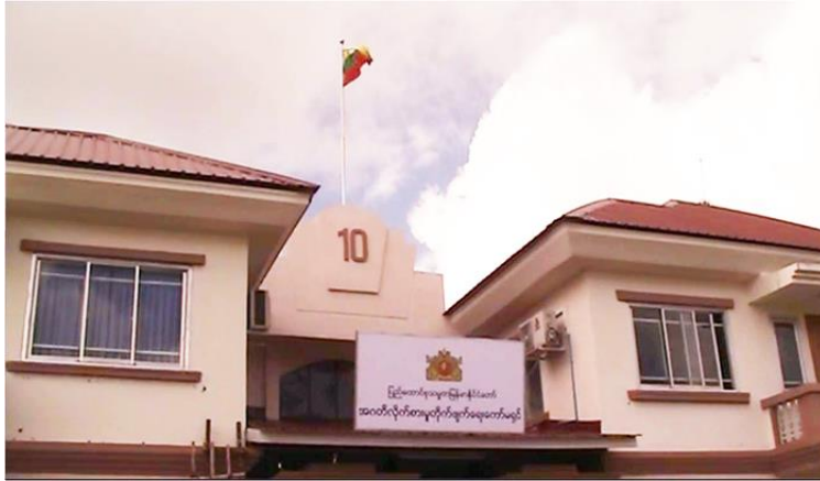
ภาพที่ 2 ที่ตั้งของ “สำนักงานคณะกรรมการต่อต้านการทุจริต” (Anti-Corruption Commission: ACC)