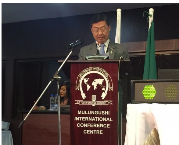
นายสุรชัย เลี้ยงบุญเลิศชัย รองประธานสภานิติบัญญัติแห่งชาติ คนที่หนึ่ง และหัวหน้าคณะผู้แทนสภานิติบัญญัติแห่งชาติ กล่าวอภิปรายทั่วไป ในหัวข้อ “การมีส่วนร่วมของคนรุ่นใหม่ในประชาธิปไตย

ภายหลังจากการอภิปราย ที่ประชุมฯ ได้เรียกร้องให้รัฐบาลและรัฐสภาประเทศต่าง ๆ แสวงหาแนวคิดใหม่ในการทำให้คนรุ่นใหม่ได้มีบทบาทและมีส่วนร่วมในกระบวนการประชาธิปไตย ปฏิรูปกลไกทางรัฐสภา และนโยบายภายในประเทศที่สนองต่อความต้องการของคนรุ่นใหม่ ส่งเสริมเทคโนโลยีที่ทันสมัยช่วยให้เกิดความโปร่งใสและตรวจสอบได้ ตลอดจนจัดตั้งคณะกรรมการพิเศษด้านเยาวชน การสร้างเครือข่ายของยุวสมาชิก เพื่อผนวกแนวคิดและมุมมองจากเยาวชนในการทำงานของรัฐสภา