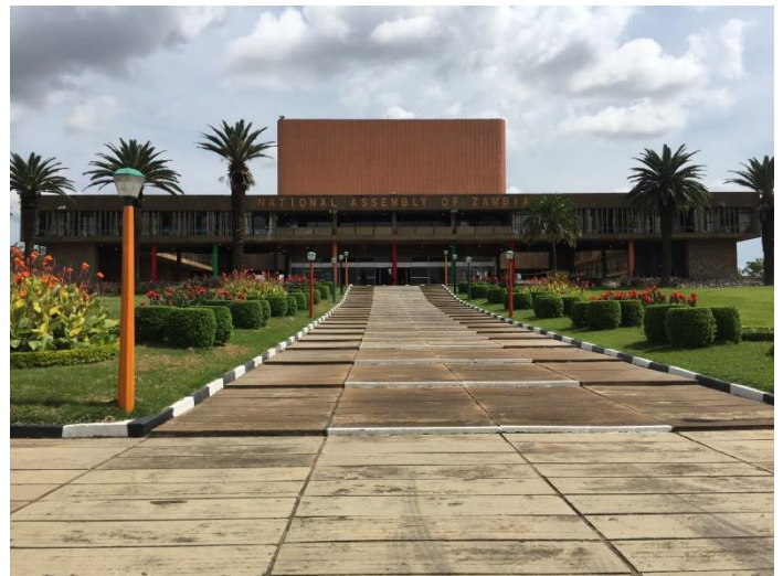
คณะผู้แทนไทยเข้าเยี่ยมชมรัฐสภาสาธารณรัฐแซมเบีย