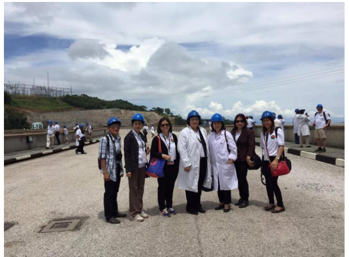
คณะผู้แทนไทยเข้าร่วมกิจกรรมทัศนศึกษาและเยี่ยมชมเขื่อน Kariba ซึ่งเป็นเขื่อนไฟฟ้าพลังน้ำที่ใหญ่ที่สุดในสาธารณรัฐแซมเบีย