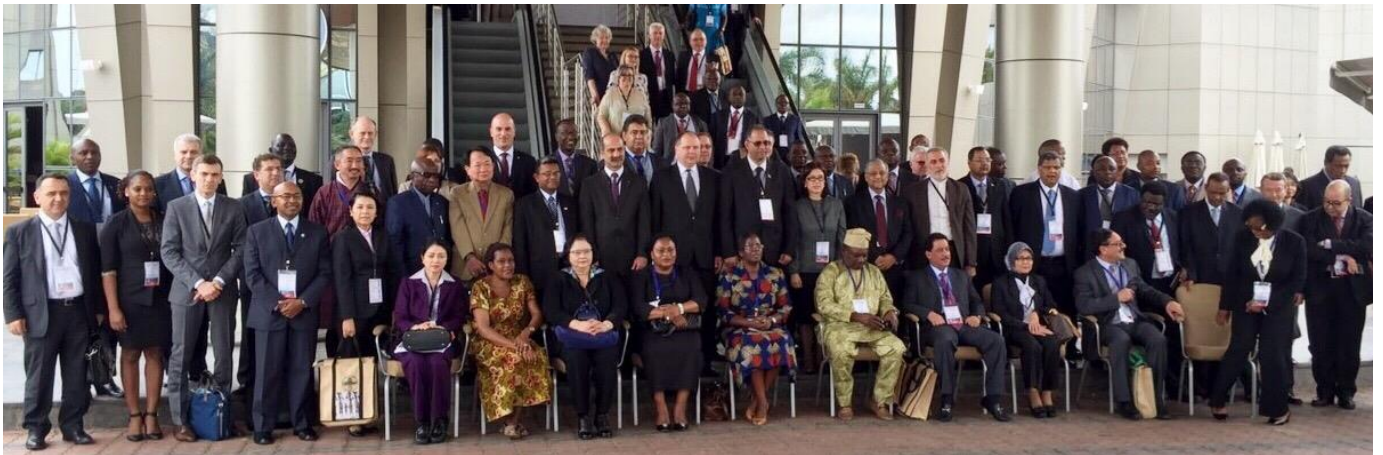
เลขาธิการสภาผู้แทนราษฎร รองเลขาธิการสภาผู้แทนราษฎร และที่ปรึกษาด้านระบบงานนิติบัญญัติ ถ่ายภาพหมู่ร่วมกับสมาชิกสมาคมเลขาธิการรัฐสภา ณ โรงแรม Radisson Blu