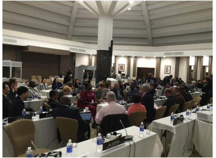
บรรยากาศภายในห้องประชุมสมาคมเลขาธิการรัฐสภา (ASGP) ณ โรงแรม Radisson Blu