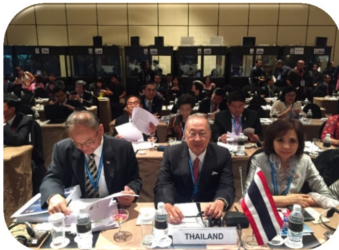
คณะผู้แทนสมาชิกรัฐสภาชาติบัญญัติแห่งชาติในการประชุมเต็มคณะ ครั้งที่ ๑