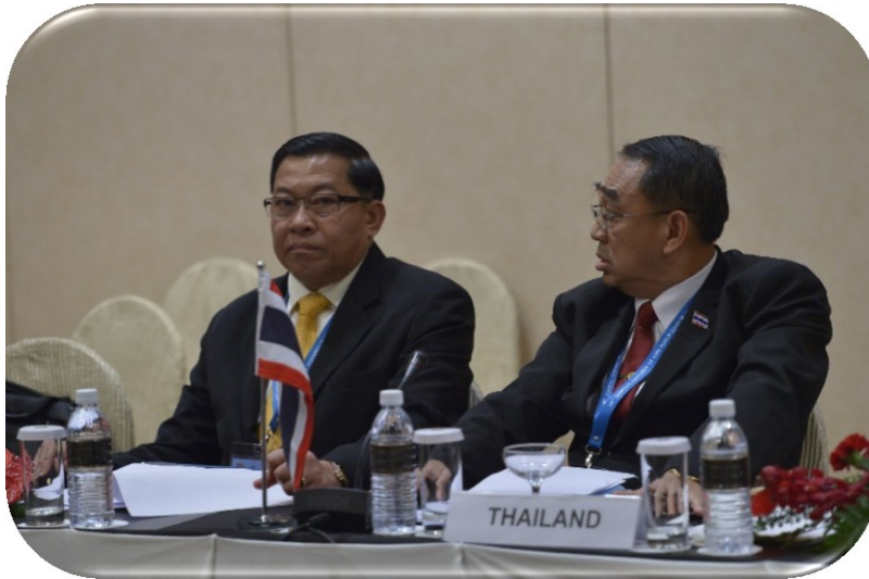
พลตำรวจเอก ชัชวาลย์ สุขสมจิตร์ และ พลอากาศเอก ชนัท รัตนอุบล สมาชิกสภานิติบัญญัติแห่งชาติ เข้าร่วมการประชุมหารือระหว่างประเทศสมาชิก AIPA กับเครือรัฐออสเตรเลีย ในการประชุมใหญ่สมัชชารัฐสภาอาเซียน ครั้งที่ ๓๖

ทั้งนี้ พลอากาศเอก ชนัท รัตนอุบล สมาชิกสภานิติบัญญัติแห่งชาติ ได้หารือกับผู้แทนจากรัฐสภาออสเตรเลียในประเด็นการสนับสนุนการแลกเปลี่ยนข้อมูลที่เกี่ยวข้องกับการต่อต้านการก่อการร้ายระหว่างไทยและออสเตรเลีย ความเป็นไปได้ที่ออสเตรเลียจะให้การสนับสนุนเงินทุนและแลกเปลี่ยนประสบการณ์ในการจัดการด้านภัยพิบัติ และการตอบโต้สถานการณ์ฉุกเฉินกับอาเซียน นอกจากนี้ยังได้กล่าวถึงการยกระดับความร่วมมือด้านความมั่นคงในภูมิภาค รวมทั้งการแลกเปลี่ยนการเยือนระหว่าง AIPA และเครือรัฐออสเตรเลีย ทั้งในระดับสมาชิก และระดับเจ้าหน้าที่