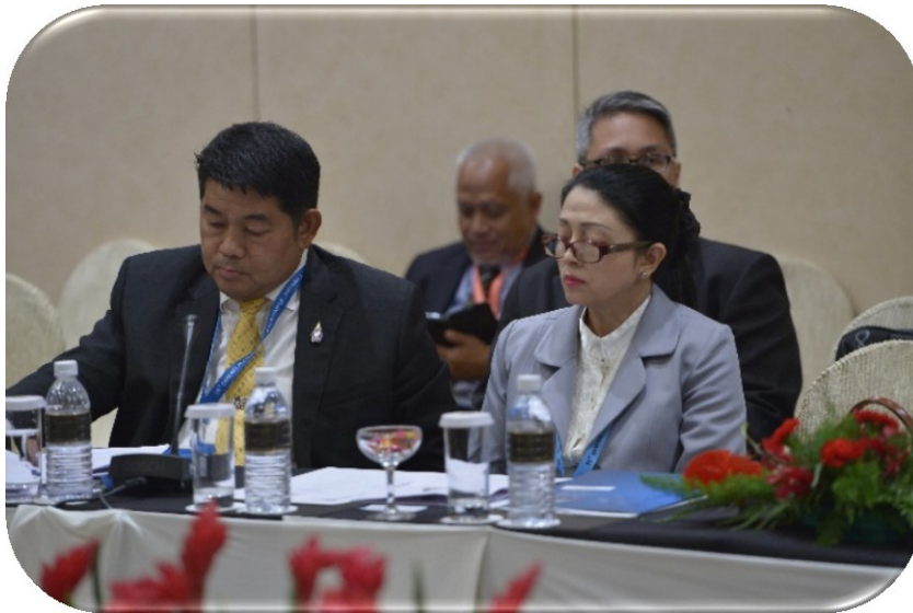
คณะผู้แทนสภานิติบัญญัติแห่งชาติในการหารือระหว่างผู้แทน AIPA กับประเทศผู้สังเกตการณ์เบลารุส

นอกจากการแลกเปลี่ยนระหว่างกันในกิจกรรมต่างๆ แล้ว ผู้แทนรัฐสภาเบลารุสมีความเห็นว่าการจัดตั้งกลุ่มมิตรภาพระหว่างรัฐสภาเบลารุสกับรัฐสภาประเทศสมาชิก AIPA จะเป็นแนวทางในการเสริมสร้างความร่วมมือในระดับรัฐสภาได้เป็นอย่างดี ผู้แทนรัฐสภาเบลารุสยังได้แจ้งต่อที่ประชุมว่าจะมีการเชิญรัฐสภาประเทศสมาชิก AIPA เดินทางเยือนรัฐสภาเบลารุส เพื่อส่งเสริมความร่วมมือระหว่างกันให้มากยิ่งขึ้น รวมทั้งการสนับสนุนจากรัฐสภาของทั้งสองฝ่ายในการแลกเปลี่ยนด้านการศึกษา วิทยาศาสตร์ และการท่องเที่ยว และความร่วมมือด้านสังคมอื่น ๆ ระหว่าง AIPA และเบลารุส จะเป็นอีกแนวทางหนึ่ง ในการส่งเสริมและสนับสนุนความร่วมมือในการสร้างภูมิภาคที่มั่นคงและมั่งคั่ง ทั้งนี้ ผู้แทนรัฐสภาเบลารุสได้ส่งมอบร่างบันทึกความเข้าใจ (MOU) ว่าด้วยความร่วมมือระหว่างรัฐสภาเบลารุสกับรัฐสภาไทยในการหารือครั้งนี้ด้วย