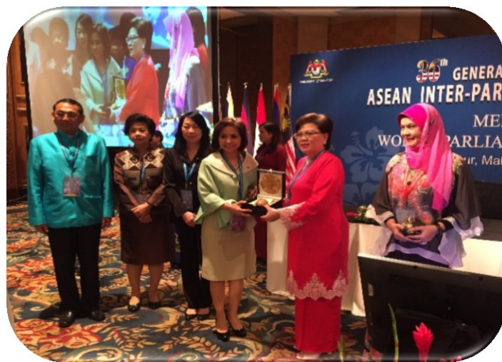
สมาชิกรัฐสภาไทยที่ระลึกและถ่ายภาพร่วมกับประธานการประชุม คณะกรรมการด้านสมาชิกรัฐสภาสตรี