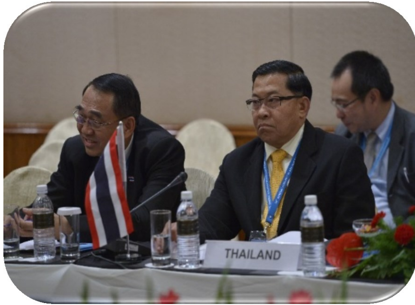
พลอากาศเอก ชนิต รัตนอุบล และ พลตำรวจเอก ชัชวาลย์ สุขสมจิตร์ สมาชิกสภานิติบัญญัติแห่งชาติเข้าร่วมการประชุมหารือระหว่างประเทศสมาชิก AIPA กับประเทศนิวซีแลนด์