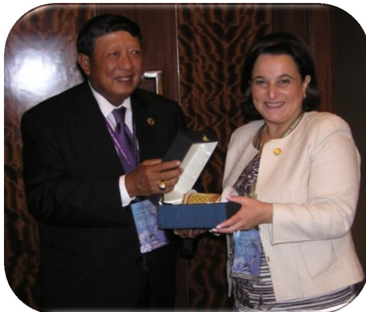
พลอากาศเอก ชาลี จันทร์เรือง ในฐานะหัวหน้าคณะผู้แทนสภานิติบัญญัติแห่งชาติ มอบของที่ระลึกแก่หัวหน้าคณะผู้แทนรัฐสภาจอร์เจีย