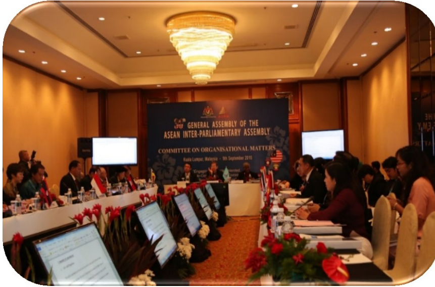
การประชุมคณะกรรมการด้านกิจการสมัชชารัฐสภาอาเซียน