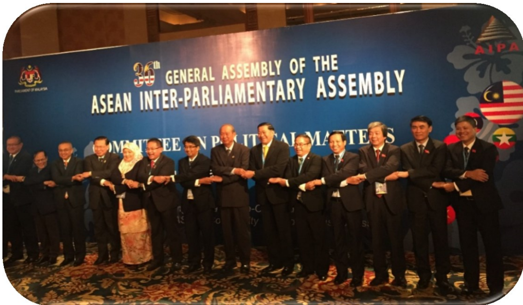
คณะผู้แทนจากประเทศสมาชิก AIPA ถ่ายภาพร่วมกันก่อนเริ่มการประชุมคณะกรรมการด้านการเมือง