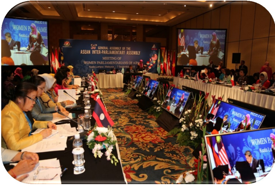
บรรยากาศในห้องประชุมคณะกรรมการด้านสมาชิกรัฐสภาสตรี

ทั้งนี้ ที่ประชุมให้การรับรองข้อติจากการประชุมคณะกรรมการด้านสมาชิกรัฐสภาสตรีของ AIPA ในวันที่ ๑๑ กันยายน ๒๕๕๘ ในการประชุมใหญ่สมัชชารัฐสภาอาเซียน ครั้งที่ ๓๖ ณ กรุงกัวลาลัมเปอร์ ประเทศมาเลเซีย