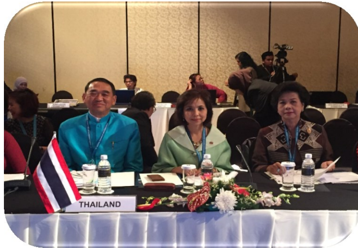
สมาชิกรัฐสภาไทยที่เข้าร่วมการประชุมคณะกรรมการด้านสมาชิกรัฐสภาสตรี