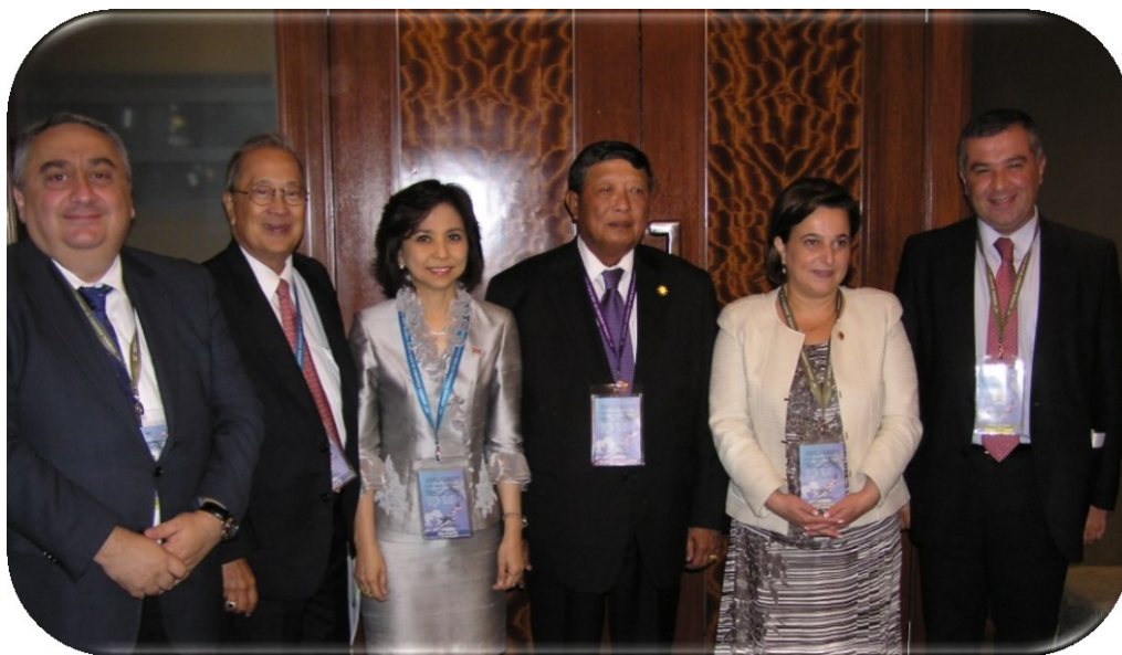
คณะผู้แทนสถานิติบัญญัติแห่งชาติและคณะผู้แทนรัฐสภาจอร์เจียถ่ายภาพร่วมกัน