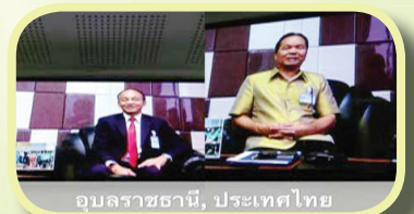
อุบลราชธานี, ประเทศไทย