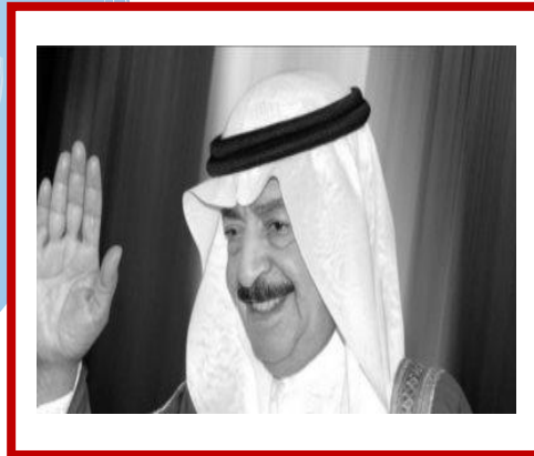
His Royal Highness Prince Khalifa bin Salman Al Khalifa