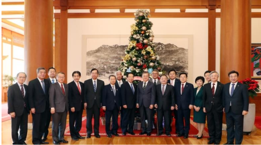
วันที่ ๑๔ ธันวาคม ๒๕๖๑ ณ ทำเนียบประธานาธิบดี นายมน แจอน ประธานาธิบดีเกาหลีใต้ให้การรับรอง คณะสมาชิกรัฐสภาญี่ปุ่น-เกาหลีใต้ ในโอกาสเดินทางเยือนเกาหลีใต้อย่างเป็นทางการ เพื่อแลกเปลี่ยนความร่วมมือและกระชับความสัมพันธ์ระหว่างสองประเทศให้แน่นแฟ้น