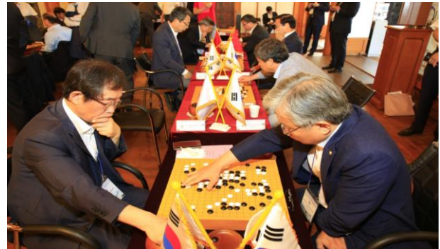
กิจกรรมแข่งขันหมากล้อมระหว่างสมาชิกรัฐสภาเกาหลีใต้-จีน-ญี่ปุ่น (Korea-China-Japan Parliamentary Friendship Go Tournament) นับเป็นกิจกรรมการแข่งขันอย่างหนึ่งในการช่วยส่งเสริมความสัมพันธ์ระหว่างประเทศ โดยกิจกรรมดังกล่าวเริ่มจัดขึ้นเป็นครั้งแรกเมื่อปี ๒๕๔๒ เป็นต้นมา