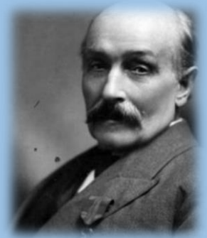
Sir William Randal Cremer