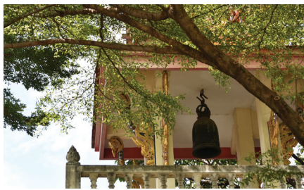
หอรระฆัง

๘. ฌาปนสถานพร้อมทั้งศาลาบำเพ็ญกุศล ฌาปนสถานเป็นอาคารคอนกรีต หลังคาทรงมณฑป มีเตาเผาศพ ๒ เตา บันไดขึ้น ๔ ด้าน ศาลาบำเพ็ญกุศล เป็นอาคารคอนกรีต กว้าง ๘ เมตร ยาว ๑๕ เมตร สูง ๑๐ เมตร หลังคามุงกระเบื้องเคลือบเป็นทรงไทย