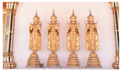
พระพุทธรูปยืนทรงเครื่อง ๔ องค์

๓. พระพุทธรูปยืนทรงเครื่อง ๔ องค์ สูงเท่าคนจริง ประดิษฐานอยู่หลังพระอุโบสถ องค์เดิมสร้างด้วยโลหะในสมัยพระธรรมถาวร (ช่าง สงกิกุโจ)