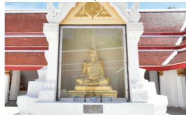
รูปเหมือนพระธรรมถาวร (เซ่ง สงักจิโจ)

๖. รูปเหมือนพระธรรมถาวร (เซ่ง สงักจิโจ) ขนาดใกล้เคียงองค์จริง หล่อด้วยทองเหลือง หล่อเสร็จเมื่อปลาย พ.ศ. ๒๕๒๔