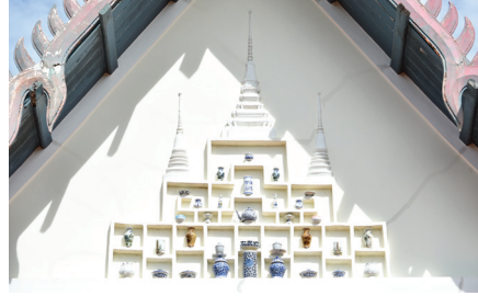
พระวิหาร

๒. พระวิหาร มีพะไลด้านหน้าและด้านหลัง กว้าง ๘ เมตร ยาว ๒๐ เมตร เดิมเป็นพระอุโบสถ สมเด็จพระเจ้าบรมวงศ์เธอ เจ้าฟ้าประไพวดี กรมหลวงเทพวดี ทรงเห็นว่าคับแคบจึงทรงบูรณะให้เป็นพระวิหาร และทรงสร้างพระอุโบสถขึ้นใหม่