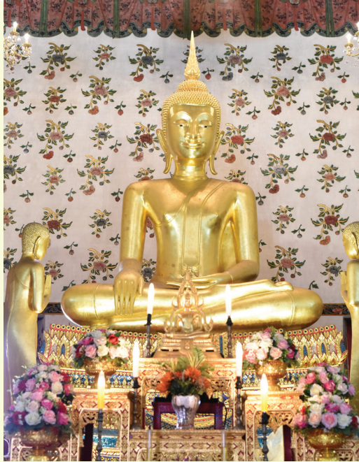
พระประธานในพระอุโบสถ เป็นพระพุทธรูปหล่อ ปิดทอง ปางมารวิชัย แบบสุโขทัย