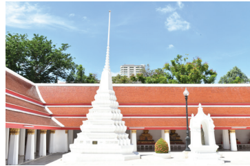
พระเจดีย์ย่อมุมไม้สิบสอง

๕. พระเจดีย์ย่อมุมไม้สิบสอง อยู่ที่มุมทั้งสี่ของพระอุโบสถ มุมละ ๑ องค์ และพระเจดีย์ทรงระฆังอยู่ที่มุม ๔ มุมพระวิหาร มุมละ ๑ องค์ องค์ที่อยู่มุมขวาด้านหลังพระวิหารเป็นของเก่า ส่วนอีก ๓ องค์ ซ่อมแซมใหม่