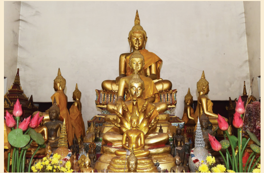
พระประธานในพระวิหาร เป็นพระพุทธรูปปูนปั้น ปิดทอง ปางมารวิชัย