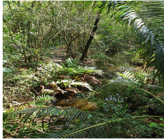
ภาพที่ 3 พื้นที่บริเวณสวนศรีนครเขื่อนขันธ์

การลงพื้นที่สำรวจข้อมูลช่วงวันที่ 29-30 มีนาคม 2562 พบว่าพื้นที่ตำบลบางกะเจ้า มีพื้นที่สวนป่าที่มีสภาพความอุดมสมบูรณ์ มีพื้นที่เกษตรกรรม สร้างความร่มรื่นและเป็นแหล่งสร้างอากาศบริสุทธิ์ และมีจำนวนนักท่องเที่ยวหนาแน่นเป็นจำนวนมากตามแหล่งท่องเที่ยวที่สำคัญ เช่น ตลาดน้ำบางน้ำผึ้ง สวนศรีนครเขื่อนขันธ์ เป็นต้น