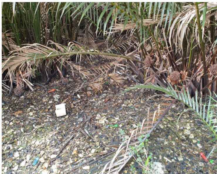
ภาพที่ 4 ขยะลอยน้ำในบริเวณป่าริมแม่น้ำ

การลงพื้นที่สำรวจข้อมูลช่วงวันที่ 29-30 มีนาคม 2562 พบว่าพื้นที่ตำบลบางกะเจ้า มีพื้นที่สวนป่าที่มีสภาพความอุดมสมบูรณ์ มีพื้นที่เกษตรกรรม สร้างความร่มรื่นและเป็นแหล่งสร้างอากาศบริสุทธิ์ และมีจำนวนนักท่องเที่ยวหนาแน่นเป็นจำนวนมากตามแหล่งท่องเที่ยวที่สำคัญ เช่น ตลาดน้ำบางน้ำผึ้ง สวนศรีนครเขื่อนขันธ์ เป็นต้น