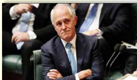
นายมาร์ติน พาร์กินสัน

วันที่ ๓๑ มกราคม ๒๕๖๑ นายมาร์ติน พาร์กินสัน หัวหน้าสำนักนายกรัฐมนตรีและคณะรัฐมนตรีออสเตรเลีย สั่งการให้หน่วยงานที่เกี่ยวข้องให้เริ่มทำการสอบสวนด่วน กรณีแฟ้มเอกสารความลับราชการหลายร้อยชิ้นถูกนำไปวางขายในร้านขายของมือสอง และตั้งข้อสังเกตว่าเป็นการละเมิดมาตรการรักษาความลับเกี่ยวกับการประชุมคณะรัฐมนตรีครั้งใหญ่ที่สุดในประวัติศาสตร์ออสเตรเลีย ตามปกติเอกสารการประชุมคณะรัฐมนตรีทั้งหมดของออสเตรเลียจะถูกปิดผนึกและรักษาไว้เป็นความลับไปจนกว่าจะมีการเผยแพร่ให้สาธารณชนทราบในอีก ๒๐ ปีต่อมา ที่ผ่านมาสักข่าวเอบีซีได้เสนอข่าวเจาะลึกเรื่องนี้มาหลายตอน แต่ไม่เปิดเผยชื่อร้านหรือคนที่ซื้อตู้เอกสารดังกล่าว ระบุว่าแฟ้มเอกสารการประชุมคณะรัฐมนตรีทั้งของรัฐบาลปัจจุบันและอีก ๕ ชุดก่อนในรอบ ๑๐ ปีที่ผ่านมา นอกจากนี้ ร้านนั้นยังขายเครื่องเฟอร์นิเจอร์เก่าในยุครัฐบาลชุดก่อน ๆ หลายรายการในราคาถูกมาก ในรายงานที่สำนักข่าวเอบีซีออกอากาศ แสดงให้เห็นว่าแฟ้มเอกสารจำนวนมากถูกตั้งไว้ในตู้เก็บเอกสารในลักษณะปิดล็อก มีคนซื้อตู้เอกสารนั้นจากร้านขายของเก่าแห่งหนึ่งในกรุงแคนเบอร์รา ตามปกติเอกสารการประชุมคณะรัฐมนตรีทั้งหมดของออสเตรเลียจะถูกปิดผนึกและรักษาไว้เป็นความลับไปจนกว่าจะมีการเผยแพร่ให้สาธารณชนทราบในอีก ๒๐ ปีต่อมา การเสนอข่าวเรื่องนี้มีขึ้นในช่วงที่รัฐสภาออสเตรเลียอยู่ระหว่างการพิจารณาร่างกฎหมายฉบับหนึ่งที่มุ่งจะป้องกันไม่ให้รัฐบาลต่างชาติเข้ามาแทรกแซงในเรื่องการเมืองของออสเตรเลีย