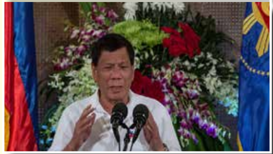
ประธานาธิบดีโรดริโก ดูเตอร์เต

วันที่ ๖ กุมภาพันธ์ ๒๕๖๑ ศาลสูงสุดของฟิลิปปินส์ ให้ความเห็นชอบการขยายเวลาของกฎอัยการศึกออกไปอีก ๑ ปี ตามคำขอของประธานาธิบดีโรดริโก ดูเตอร์เต ของฟิลิปปินส์ ซึ่งครอบคลุมพื้นที่ภาคใต้ของประเทศ ก่อนหน้านี้ นายดูเตอร์เตประกาศกฎอัยการศึกครอบคลุมทั้งเกาะมินดาเนาของฟิลิปปินส์ในเดือนพฤษภาคมปีที่แล้ว เพื่อการสู้รบกับกลุ่มติดอาวุธที่สนับสนุนกลุ่มก่อการร้ายไอเอสที่ก่อความไม่สงบในเมืองมาราวิ ทางรัฐสภาฟิลิปปินส์เห็นชอบแผนของ นายดูเตอร์เตที่จะขยายเวลาไปจนหมดปี ๒๕๖๑ แต่นักเคลื่อนไหวด้านสิทธิมนุษยชนคัดค้านเพราะเกรงว่าจะเกิดปัญหาการใช้อำนาจเผด็จการ จึงร้องขอให้ศาลฎีกาพิจารณา โดยศาลฎีกาได้ออกแถลงการณ์วันนี้ ให้ความเห็นชอบการขอต่อเวลาของกฎอัยการศึกตามที่รัฐบาลและรัฐสภายื่นขอ ด้วยคะแนนเสียง ๑๐ ต่อ ๕