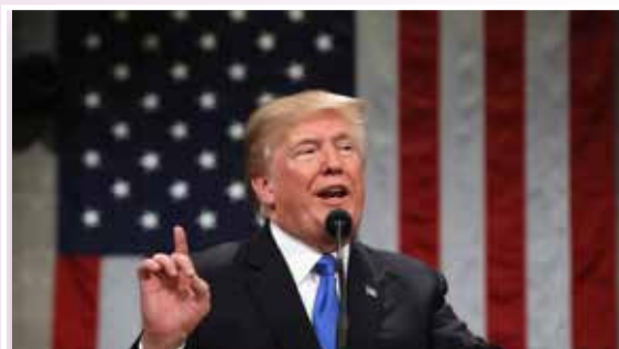
ประธานาธิบดีโดนัลด์ ทรัมป์

วันที่ ๓๑ มกราคม ๒๕๖๑ ประธานาธิบดีโดนัลด์ ทรัมป์ ของสหรัฐฯ ได้ขึ้นกล่าวสุนทรพจน์และแถลงนโยบายประจำปีต่อสภาองเกรสเป็นครั้งแรก หลังเข้ารับตำแหน่งผู้นำสหรัฐฯ ครบ ๑ ปี ทรัมป์ยกย่องว่าสหรัฐฯ ปลอดภัยเข้มแข็ง และนำภาคภูมิใจ ภายใต้การบริหารงานของตนเอง โดยบอกว่าเป็นช่วงเวลาที่ดีที่สุดที่ชาวอเมริกันจะได้เริ่มต้นใช้ชีวิตตามแนวคิดแบบ American Dream ซึ่งตั้งอยู่บนพื้นฐานของความเท่าเทียม รวมถึงสิทธิและเสรีภาพในการดำเนินชีวิต ผลงานเด่นที่ทรัมป์กล่าว คือ นโยบายด้านเศรษฐกิจ เห็นได้จากสภาพเศรษฐกิจที่ฟื้นตัวขึ้น ตัวเลขจ้างงานในประเทศที่เพิ่มขึ้นถึง ๒ ล้าน ๔ แสนตำแหน่ง รวมถึงตลาดหลักทรัพย์ที่พุ่งทะยาน แม้ว่าจะสวนทางกับคะแนนนิยมของเขาลดต่ำลงอย่างต่อเนื่องก็ตาม นอกจากนี้ ทรัมป์ยังเรียกร้องให้พรรคเดโมแครตประนีประนอม เพื่อให้สามารถบรรลุข้อตกลงต่าง ๆ และทำงานร่วมกันได้ ซึ่งคาดว่าหมายถึงข้อเสนอของเขาที่จะให้สัญชาติเยวชนที่เข้าเมืองผิดกฎหมายหรือดริมเมอร์ส แลกกับการให้เดโมแครตช่วยอนุมัติงบสร้างกำแพงกั้นพรมแดนสหรัฐฯ-เม็กซิโก ส่วนนโยบายด้านต่างประเทศ ทรัมป์ประกาศว่า แทบทุกพื้นที่ในซีเรียและอิรักที่เคยตกอยู่ภายใต้การปกครองของกลุ่มรัฐอิสลามหรือไอเอส ถูกยึดคืนได้หมดแล้ว แต่ปฏิบัติการกวาดล้างกลุ่มก่อการร้ายกลุ่มนี้จะยังดำเนินต่อไป จนกว่าไอเอสทั้งหมดจะพ่ายแพ้ รวมทั้ง ทรัมป์ยังได้ประณามเกาหลีเหนือที่ยังคงเดินหน้าพัฒนาขีปนาวุธและอาวุธนิวเคลียร์ที่เป็นภัยกับสหรัฐฯ ซึ่งรัฐบาลจะใช้มาตรการทั้งหมดกดดันไม่ให้เกิดขึ้น รวมถึงมีการกล่าวถึงคู่แข่งอย่างรัสเซียและเงินที่ทำลายผลประโยชน์ของสหรัฐฯ ด้วย