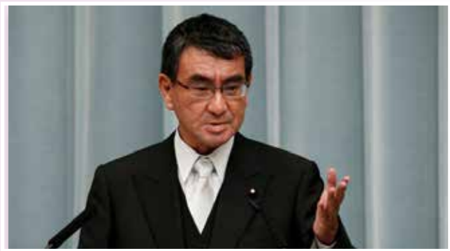
นายทาโร โคโนะ

วันที่ ๒๒ มกราคม ๒๕๖๑ นายทาโร โคโนะ รัฐมนตรีต่างประเทศของญี่ปุ่น เปิดเผยว่า ญี่ปุ่นจะยังคงจุดยืนในการเพิ่มแรงกดดันเพื่อให้เกาหลีเหนือล้มเลิกโครงการอาวุธนิวเคลียร์และขีปนาวุธ แทนที่จะสนับสนุนวิธีการเจรจาตามที่ยินยอมพลัดกัน โดยนายโคโนะได้แสดงจุดยืนดังกล่าวในระหว่างการประชุมรัฐสภาสมัยสามัญระยะเวลา ๑๕๐ วัน ซึ่งเริ่มต้นขึ้นในวันนี้ โดยก่อนหน้านี้ รัฐมนตรีว่าการกระทรวงการต่างประเทศญี่ปุ่นได้ประชุมร่วมกับรัฐมนตรีต่างประเทศและเจ้าหน้าที่จากสหรัฐอเมริกา เกาหลีใต้ และประเทศอื่น ๆ อีก ๑๗ ประเทศในเมืองแวนคูเวอร์ ซึ่งนายโคโนะได้กล่าวกับที่ประชุมว่า การประชุมร่วมระหว่างเกาหลีเหนือและใต้เป็นสิ่งที่ไม่ควรใช้เป็นเวลาเท่านั้น นอกจากนี้นายโคโนะยังกล่าวต่อสภาไดเอทว่า ญี่ปุ่นจะไม่จัดการเจรจาร่วมกับเกาหลีเหนือเพื่อแลกมาซึ่งความผ่อนคลายเพียงชั่วคราว โดยญี่ปุ่นจะไม่ยอมให้เกาหลีเหนือพัฒนาอาวุธนิวเคลียร์และขีปนาวุธแน่นอน พร้อมทั้งกล่าวด้วยว่า การยกระดับการกดดันเกาหลีเหนืออย่างต่อเนื่องนั้นเป็นสิ่งจำเป็น