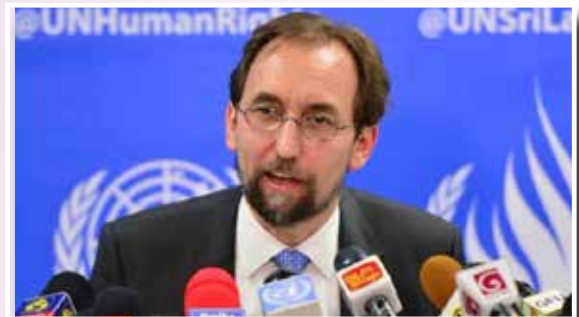
นายซาอิด ราฮัด อัล ฮุสเซน

รัฐบาลอินโดนีเซียกำลังเร่งพิจารณาผ่านร่างกฎหมายให้ “การรักร่วมเพศและการมีเพศสัมพันธ์นอกสมรส” เป็นอาชญากรรม กฎหมายนี้จะมีผลบังคับใช้ภายในวันวาเลนไทน์ ๑๔ กุมภาพันธ์ ๒๕๖๑ โดยนายซาอิด ราฮัด อัล ฮุสเซน ข้าหลวงใหญ่คณะมนตรีสิทธิมนุษยชนแห่งสหประชาชาติ แถลงเมื่อวันที่ ๘ กุมภาพันธ์ ๒๕๖๑ ว่า แนวความคิดแบบสุดโต่งของรัฐบาลอินโดนีเซีย ที่กำหนดให้การรักร่วมเพศเป็นอาชญากรรมนั้น มีความน่าเป็นห่วงอย่างมาก เพราะถือเป็นการข่มขู่ให้สังคมเกิดความแตกแยก เกิดการเลือกปฏิบัติ เกิดความเกลียดชัง และอาจนำไปสู่ความรุนแรงในอินโดนีเซียเอง โดยเฉพาะในพื้นที่จังหวัดอาเจะห์ ที่ปกครองโดยกฎหมายชารีอาฮ์ ที่เคยมีการจับกุมและลงโทษกลุ่มรักร่วมเพศหลาย ๆ ครั้ง และยังเปรียบเทียบอีกว่า หากอินโดนีเซีย ซึ่งเป็นประเทศมุสลิม ต้องการต่อต้านแนวความคิดการเกลียดกลัวชาวมุสลิม เพื่อไม่ให้ผู้คนทั่วโลกเหมารวมและเลือกปฏิบัติ อินโดนีเซียเองก็ควรยุติแนวคิดการเลือกปฏิบัติในบ้านของตนเองก่อน เพราะการเลือกปฏิบัติ ในทางศาสนา เป็นเรื่องที่ผิด และการเลือกปฏิบัติทางเพศก็เป็นเรื่องที่ผิดเช่นกัน โดยคำแถลงการณ์นี้มีขึ้นหลังจากที่นายซาอิด เดินทางไปยังอินโดนีเซีย เพื่อหารือในประเด็นนี้ร่วมกับรัฐสภาอินโดนีเซีย โดยในระหว่างการประชุม ประธานาธิบดีโจโก วิโดโด ของอินโดนีเซีย พยายามอธิบายว่า เหตุใดอินโดนีเซียถึงไม่สามารถยอมรับกลุ่มคนรักเพศเดียวกันได้ โดยนายวิโดโด อ้างถึงวัฒนธรรมท้องถิ่นและความเชื่อของคนในประเทศ