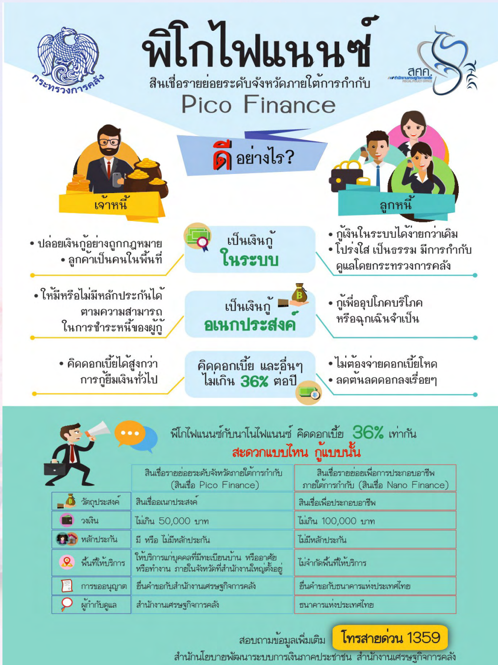
ภาพที่ ๒ แสดงรายละเอียดของโครงการสินเชื่อรายย่อยระดับจังหวัดภายใต้การกำกับหรือ พิกโกไฟแนนซ์ (Pico Finance) ที่มา: กลุ่มสารนิเทศการคลัง สำนักงานปลัดกระทรวงการคลัง “การบริหารงานเพื่อการแก้ไขปัญหาหนี้ นอกระบบอย่างยั่งยืน” ข่าวกระทรวงการคลัง ๑๓๖(๒๕๕๙): ๒.