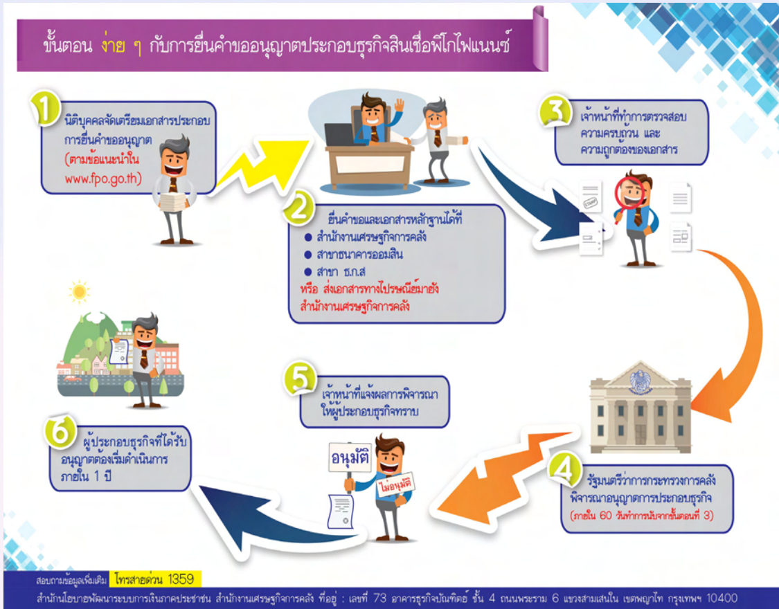
ภาพที่ ๓ แสดงขั้นตอนการยื่นคำขออนุญาตประกอบธุรกิจสินเชื่อรายย่อยระดับจังหวัดภายใต้การกำกับ หรือพีโก ไฟแนนซ์ (Pico Finance)

ที่มา: กลุ่มสารนิเทศการคลัง สำนักงานปลัดกระทรวงการคลัง “การบริหารงานเพื่อการแก้ไขปัญหาหนี้ในระบบ อย่างยั่งยืน” ข่าวกระทรวงการคลัง ๑๓๖(๒๕๕๙): ๓