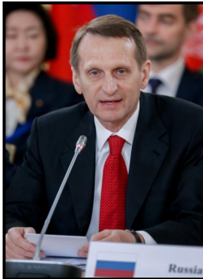
H.E. Mr. Sergey Naryshkin ประธานสภาดูมาแห่งสหพันธรัฐรัสเซีย ขณะแสดงคำกล่าว (Address) ต่อที่ประชุม

ภายหลังจากเสร็จสิ้นพิธีเปิด ที่ประชุมได้เริ่มการอภิปรายในหัวข้อ “ความร่วมมือระหว่างรัฐสภาเพื่อความมั่งคั่งร่วมกันของประเทศในภูมิภาคยูเรเชียในศตวรรษที่ ๒๑ (Inter - Parliamentary Cooperation for Joint Prosperity of Eurasian Countries in the 21 st Century)” โดยประธานสภาดูมาและประธานรัฐสภาสาธารณรัฐเกาหลีได้รับเกียรติให้เป็นผู้เริ่มแสดงคำกล่าว (Address) ต่อที่ประชุมก่อน แล้วจึงกล่าวเชิญให้ประธานรัฐสภาที่มาเข้าร่วมประชุมได้แสดงคำกล่าวตามลำดับพยานุเคราะห์ภาษาอังกฤษตัวแรกของชื่อประเทศ เมื่อประธานรัฐสภาแสดงคำกล่าวเสร็จเรียบร้อยแล้ว รองประธานรัฐสภาที่มาเข้าร่วมจึงได้รับเชิญให้แสดงคำกล่าว ต่อที่ประชุมตามลำดับพยานุเคราะห์ภาษาอังกฤษตัวแรกของชื่อประเทศเช่นกัน ทั้งนี้ ผู้ที่ได้รับเชิญให้แสดงคำกล่าวเป็นคนสุดท้าย คือ ผู้แทนโลกสภาแห่งสาธารณรัฐอินเดีย