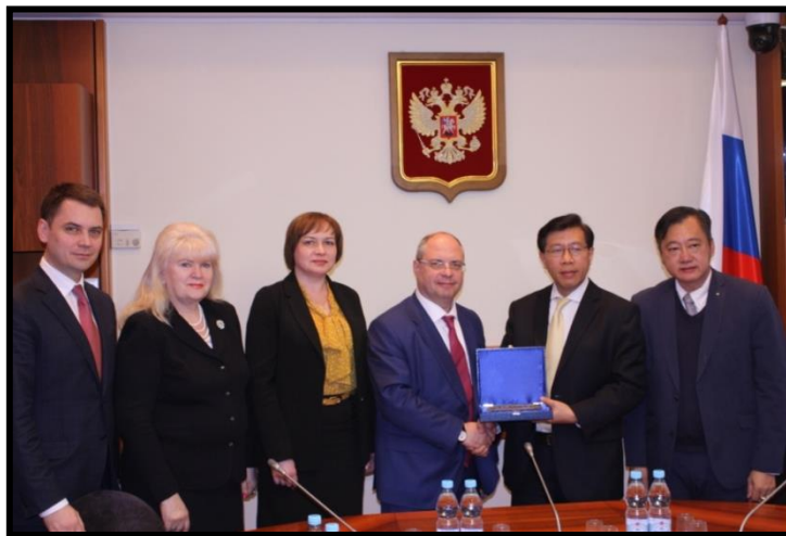
คณะผู้แทนสภานิติบัญญัติแห่งชาติ ขณะรับมอบของที่ระลึก จากคณะผู้แทนกลุ่มมิตรภาพสมาชิกรัฐสภารัสเซีย - ไทย ในช่วงท้ายของการหารือ

สุดท้ายนี้ ตนขอขอบคุณที่ประเทศรัสเซียยินยอมอยู่เคียงข้างประเทศไทยมาตลอด ๑๒๐ ปี หากฝ่ายรัสเซียมีข้อหารือประการใดกับฝ่ายไทย ขอให้หารือผ่านทางเอกอัครราชทูตไทย ณ กรุงมอสโก ทั้งนี้ หากมีข้อหารือประการใดกับฝ่ายรัสเซีย ฝ่ายไทยจะหารือผ่านทางเอกอัครราชทูตรัสเซีย ณ กรุงเทพมหานคร เช่นกัน