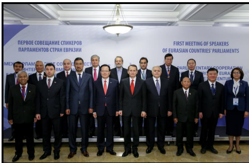
หัวหน้าคณะผู้แทนรัฐสภาที่มาเข้าร่วมการประชุมถ่ายภาพร่วมกัน