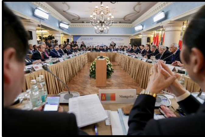
บรรยากาศในที่ประชุมประธานรัฐสภาของประเทศในภูมิภาคยูเรเชีย ครั้งที่ ๑

ในช่วงท้ายของการประชุม เมื่อเวลาประมาณ ๑๘.๐๐ นาฬิกา ที่ประชุมได้รับรองคำแถลงสุดท้าย (Final Statement) ๖ ซึ่งมีสาระสำคัญครอบคลุมประเด็นต่าง ๆ ที่มีการอ้างถึงในคำกล่าวของคณะผู้แทนรัฐสภา ทุกคณะ ทั้งด้านการเมือง เศรษฐกิจ และสังคม อาทิ เรื่องการสร้างสันติภาพ การส่งเสริมความร่วมมือทางนิติบัญญัติ การพัฒนาเวทีการสานเสวนาระหว่างรัฐสภา (Inter - parliamentary dialogues) การสร้างความเชื่อมโยงภายในภูมิภาคยูเรเชีย การสร้างความมั่นคงทางเศรษฐกิจและวัฒนธรรม การปกป้องสิ่งแวดล้อม ตลอดจนการแก้ไขปัญหาข้ามพรมแดน โดยเฉพาะอย่างยิ่งการก่อการร้ายและการโยกย้ายถิ่นฐาน นอกจากนี้ คำแถลงสุดท้ายยังระบุถึงความเห็นพ้องของคณะผู้แทนรัฐสภาที่เข้าร่วมประชุมครั้งนี้ ให้มีการจัดประชุมประธานรัฐสภาของประเทศในภูมิภาคยูเรเชียขึ้นเป็นประจำทุกปี โดยการประชุมครั้งถัดไปในปี ๒๕๖๐ จะจัดขึ้น ณ สาธารณรัฐเกาหลี