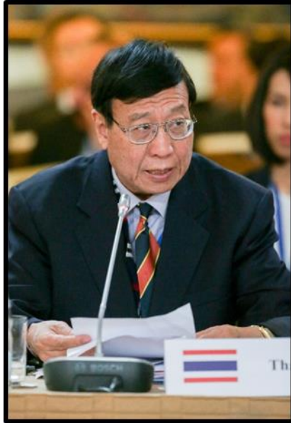
ศาสตราจารย์พิเศษพรเพชร วิชิตชลชัย ประธานสภานิติบัญญัติแห่งชาติ ขณะแสดงคำกล่าวต่อที่ประชุม

ในการนี้ ศาสตราจารย์พิเศษพรเพชร วิชิตชลชัย ประธานสภานิติบัญญัติแห่งชาติ ได้แสดงคำกล่าว (Address) ต่อที่ประชุม โดยมีสาระสำคัญเป็นการแสดงวิสัยทัศน์จากมุมมองของสภานิติบัญญัติแห่งชาติเกี่ยวกับแนวทางในการบรรลุเป้าหมายของการประชุมครั้งนี้ ๕ ประเด็นสำคัญของคำกล่าวข้างต้นสามารถสรุปได้ ๓ ประการ ประการแรก คือ การสร้างความร่วมมือทางนวัตกรรมจะเป็นกุญแจสำคัญอันนำไปสู่ความมั่งคั่งร่วมกันของภูมิภาค ทั้งยังเป็นกุญแจสำคัญในการบูรณาการเป้าหมายทั้งสามของการประชุมนี้เข้าด้วยกัน ประการที่สอง คือ นวัตกรรมเป็นปัจจัยสำคัญของการสร้างความมั่งคั่งในทุกระดับของการพัฒนา การสร้างความร่วมมือในการแลกเปลี่ยนนวัตกรรม ตลอดจนการสร้างสมรรถนะร่วมกันทางวิทยาศาสตร์และเทคโนโลยี จึงเป็นสิ่งสำคัญที่จะอำนวยความสะดวกเลื่อนระดับการพัฒนาเป็นไปได้อย่างรวดเร็วยิ่งขึ้น สำหรับประเทศไทย แม้จะมีฐานทรัพยากรทางการเกษตรเป็นปัจจัยสนับสนุนการพัฒนา แต่การเปลี่ยนผ่านจากเศรษฐกิจที่อิงการผลิตและขับเคลื่อนด้วยประสิทธิภาพ (Production - based, efficiency - driven economy) ไปสู่เศรษฐกิจที่อิงการสร้างคุณค่าและขับเคลื่อนด้วยนวัตกรรม (Value - based, innovation - driven economy) ซึ่งประเทศไทยกำลังเผชิญอยู่นั้น จำเป็นต้องอาศัยความก้าวหน้าทางเทคโนโลยีที่ต่อเนื่องมาเป็นปัจจัยสนับสนุน และ ประการที่สาม คือ รัฐสภาต่าง ๆ มีบทบาทอย่างสูงในกระบวนการสร้างความมั่งคั่งในฐานะผู้กำหนดบริบท (Context shaper) ในการดำเนินการของฝ่ายบริหาร เนื่องจากรัฐสภาเป็นองค์กรที่ตรากฎหมายและพิจารณาอนุมัติงบประมาณแผ่นดิน หากปราศจากโครงสร้างพื้นฐานทางกฎหมายจากฝ่ายนิติบัญญัติ ฝ่ายบริหารจะไม่สามารถดำเนินการพัฒนาใด ๆ อันนำไปสู่ความมั่งคั่งได้