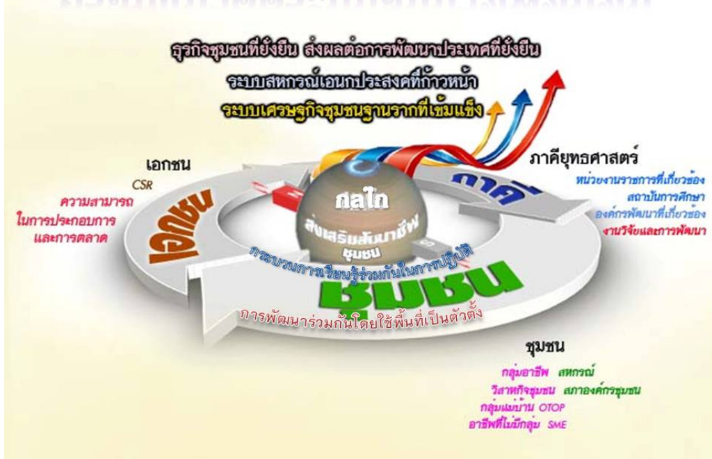
แผนภาพที่ ๓ แสดงกรอบแนวคิดระบบสัมมาชีพชุมชน