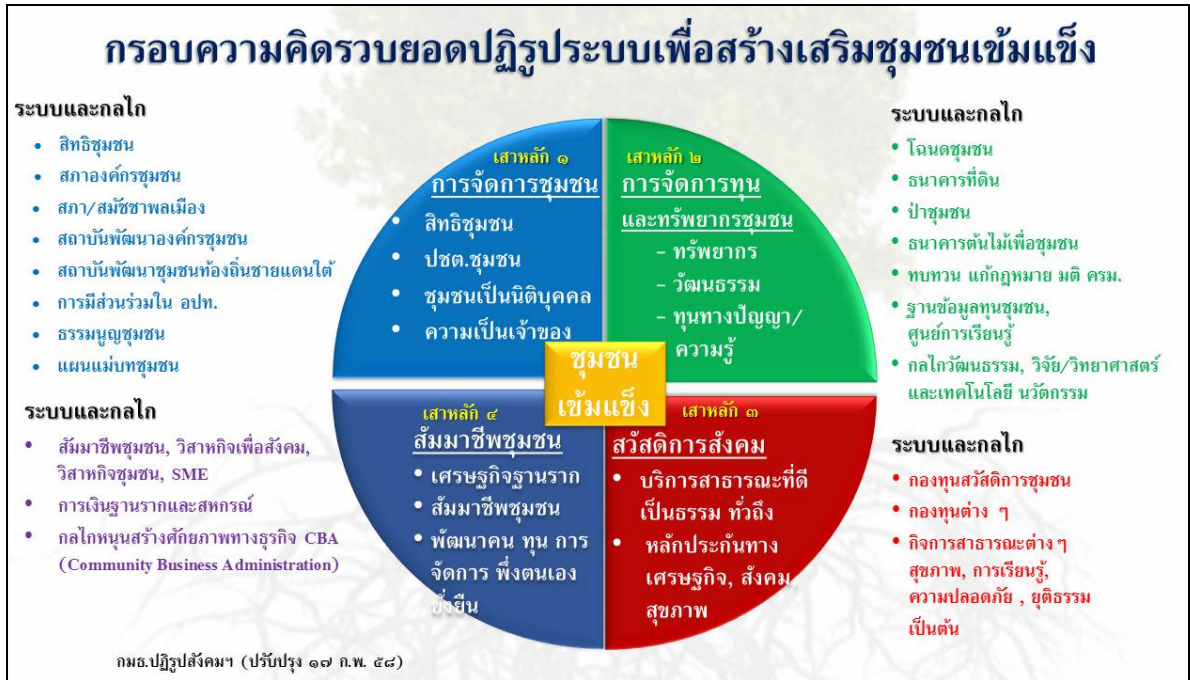
แผนภาพที่ ๑ กรอบแนวคิดการปฏิรูประบบเพื่อสร้างเสริมชุมชนเข้มแข็ง

ทางสังคมที่เท่าเทียมให้กับชุมชนในด้านสวัสดิการชุมชน และชุมชนมีส่วนร่วมจัดบริการสาธารณะ และผลสัมฤทธิ์ที่ ๔ การพัฒนาระบบเศรษฐกิจชุมชน การทำให้เศรษฐกิจฐานรากเข้มแข็งและยั่งยืน ปรากฏตามแผนภาพที่ ๑