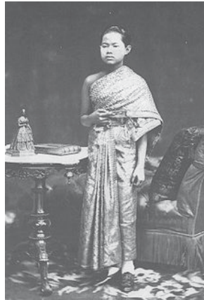
สมเด็จพระนางเจ้าสุนันทากุมารีรัตน์