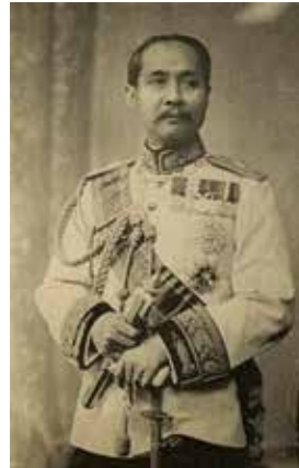
พระบาทสมเด็จพระจุลจอมเกล้าเจ้าอยู่หัว

ทรงพระกรุณาโปรดเกล้าฯ ให้เริ่มการสร้างสวนนั้นเมื่อพุทธศักราช ๒๔๕๑ และพระราชทานนามว่า “สวนสุนันทา” (นัยว่าเพื่อเป็นอนุสรณ์แด่สมเด็จพระนางเจ้าสุนันทากุมารีรัตน์ พระบรมราชเทวี ในพระบาทสมเด็จพระจุลจอมเกล้าเจ้าอยู่หัว) แต่การสร้างสวนสุนันทายังไม่ทันเสร็จสมบูรณ์ตามพระราชประสงค์ก็เสด็จสวรรคตเสียก่อน